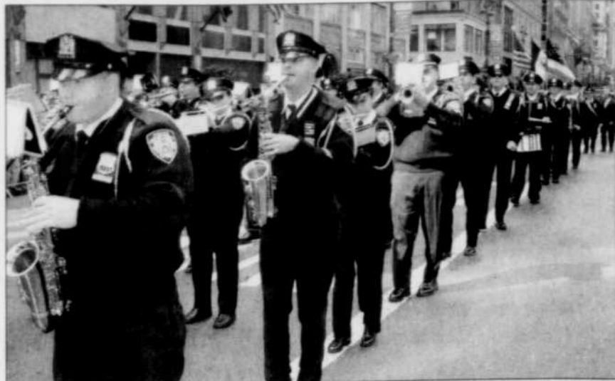
Le NYPD band est l'un des prestigieux invités du Festival international des musiques militaires de Québec.