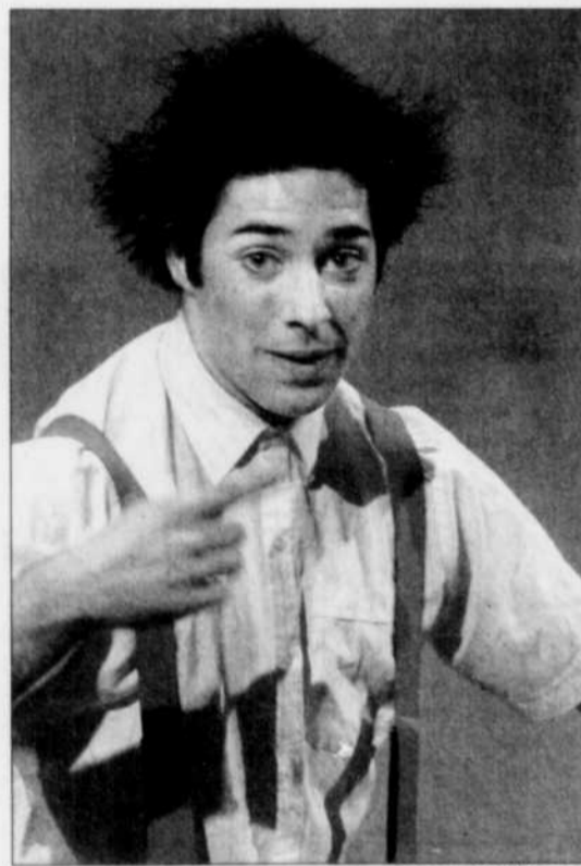
Le clown Rose, du Théâtre de l'Aubergine, a offert un extrait ludique du spectacle qui sera présenté à la bibliothèque Gabrielle-Roy le 29 janvier 2006.

À l'approche du temps des Fêtes, les enfants