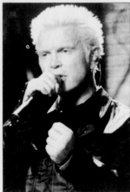
Billy Idol en spectacle

Informations : Bonjour Québec 1 877-bonjour www.quebecregion.com