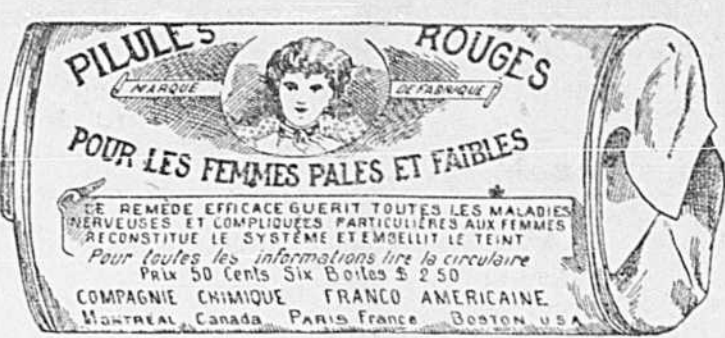
Fac-similé exact d'une boîte de Pilules Rouges.

Nos Pilules Rouges sont une spécialité pour les maladies des femmes seulement; c'est ce qui fait leur force et leur popularité. Il est impossible à un remède de guérir tous les maux. Jamais, dans l'histoire de la médecine, un remède n'a obtenu autant de guérisons que nos Pilules Rouges . Nous demandons à nos nombreuses clientes de ne pas comparer nos Pilules Rouges aux autres remèdes guérissant tous les maux, entre autres, aux remèdes liquides qui ne doivent leur effet stimulant qu'à l'alcool qu'ils renferment.