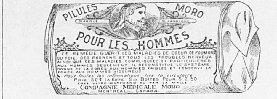
Fac-Simile exact d'une boîte de Pilules Moro.

Donnez-nous un homme brisé par les excès, la dissipation, un travail trop dur, les tracass, ou par toute autre cause qui ait sapé sa vitalité, avec les Pilules Moro nous le rendrons aussi vigoureux en tous points, que n'importe quel homme de son âge.