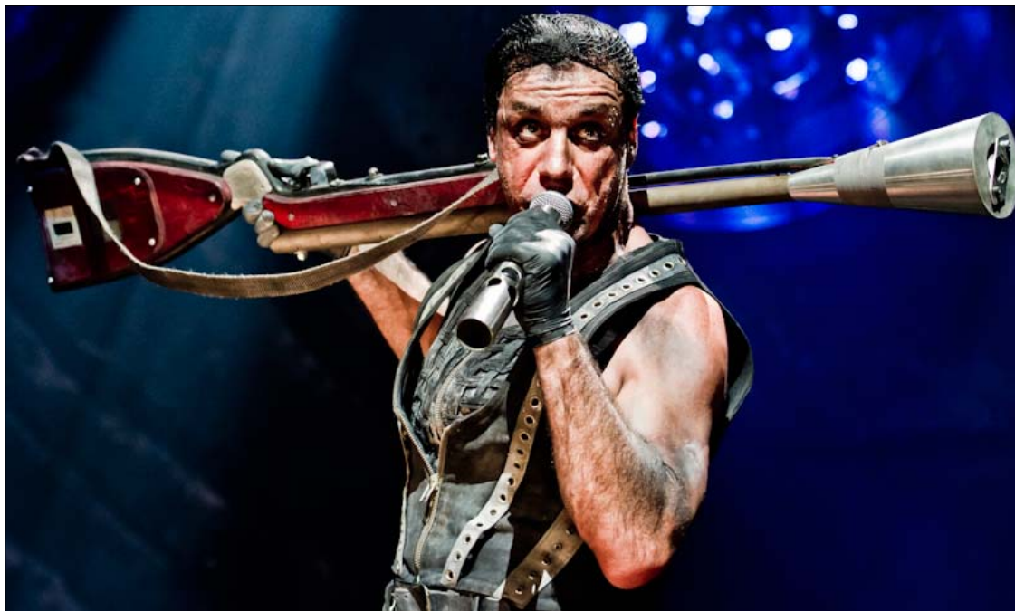
Till Lindemann avec son fusil de chasse grotesque lance-flamme.

La formation allemande interprète également des pièces provenant des albums précédents, dont « Keine Lust » (de l'album « Reise Reise »), durant laquelle le bassiste Oliver Riedel a interprété un original solo de bass n'apparaissant pas sur l'album. Parmi les autres « classiques » joués par le groupe au cours du set principal, on retrouve « Feuer Frei » avec les nombreux jets de lance-flammes et « Benzin », durant lequel le chanteur enflamme littéralement un cascadeur