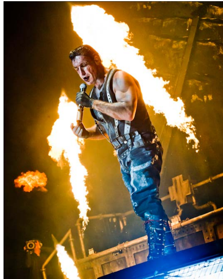
Des flammes, des jets de feu. Encore des flammes...