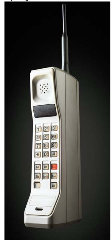
Dans le temps où les téléphones cellulaires servaient à téléphoner

qui sont tous aussi surpris les uns que les autres, un extrait d'une caméra de surveillance, l'essentiel des événements et le journaliste termine en disant que l'intégrale de la vidéo est disponible sur le site... je ne sais pas, mais je trouvais que c'était le summum de l'émotion en terme de sensationnalisme. Je voulais le partager !