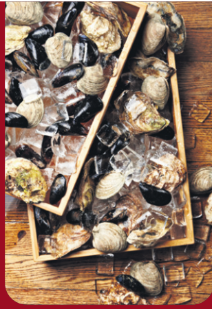
P.2 LES HUÎTRES ET MOULES DE CHEZ GIDNEY