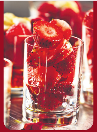
P.4 BOUTIQUE VARIATION, COMPLICE DE VOTRE SAINT-VALENTIN