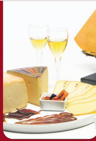
P.3 LA FROMAGERIE DES NATIONS, POUR L'AMOUR DU FROMAGE