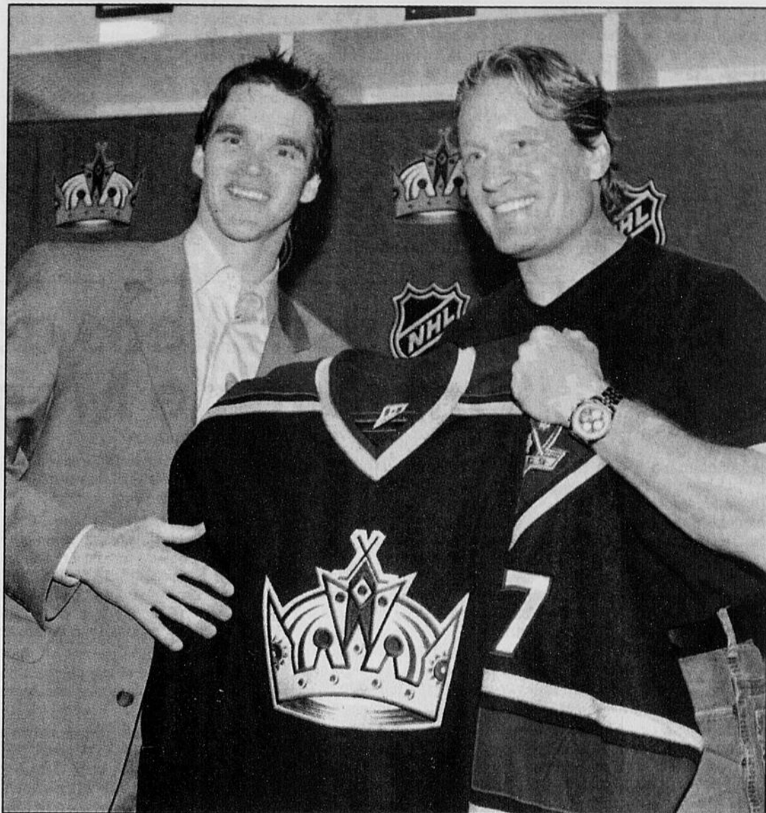
Jeremy Roenick, à droite, fait maintenant partie des Kings de Los Angeles et c'est Luc Robitaille qui a été chargé de lui souhaiter la bienvenue, hier, en lui remettant son chandail en vue de la prochaine saison. Roenick gagnera 4,94 millions $ en 2005-2006.

Un autre Québécois, Alex Tanguay, a accepté l'offre qualificative de l'Avalanche du Colorado, tout comme le défenseur Kurt Sauer. Ils gagneront respecti-