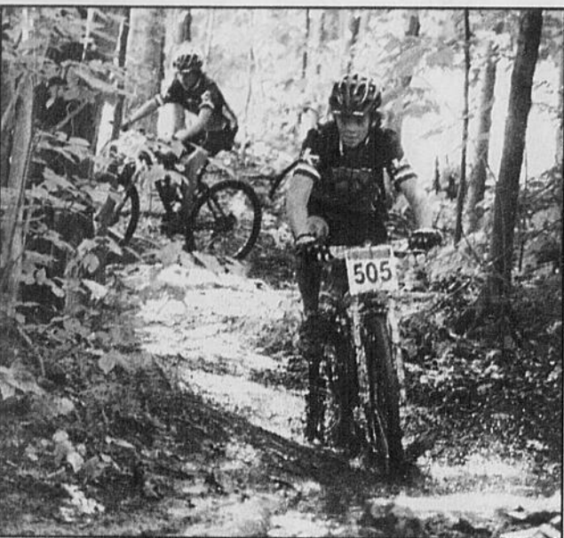
Les sous-bois de East Hereford recevront de nombreux adeptes du vélo de montagne dans le cadre du Raid Jean-D'Avignon.

Pour plus d'informations sur le Raid/Marathon Jean D'Avignon et pour les inscriptions, vous pouvez vous rendre sur le site web suivant: http://www.municipalite.easthereford.qc.ca/raid/index.htm .