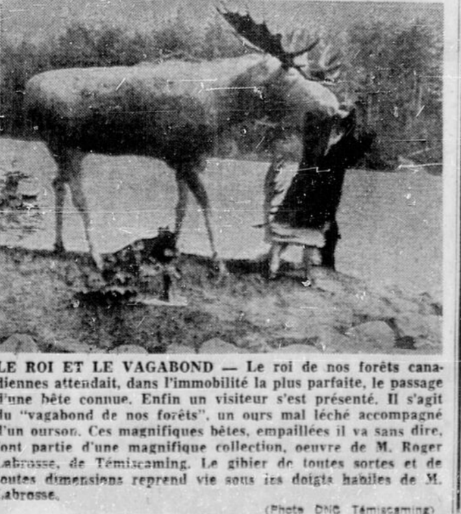
LE ROI ET LE VAGABOND — Le roi de nos forêts canadiennes attendait, dans l'immobilité la plus parfaite, le passage d'une bête connue. Enfin un visiteur s'est présenté. Il s'agit du "vagabond de nos forêts", un ours mal léché accompagné d'un oursin. Ces magnifiques bêtes, empalées il va sans dire, font partie d'une magnifique collection, oeuvre de M. Roger Labrosse, de Témiscaming. Le gibier de toutes sortes et de toutes dimensions reprend vie sous les doigts habiles de M. Labrosse.