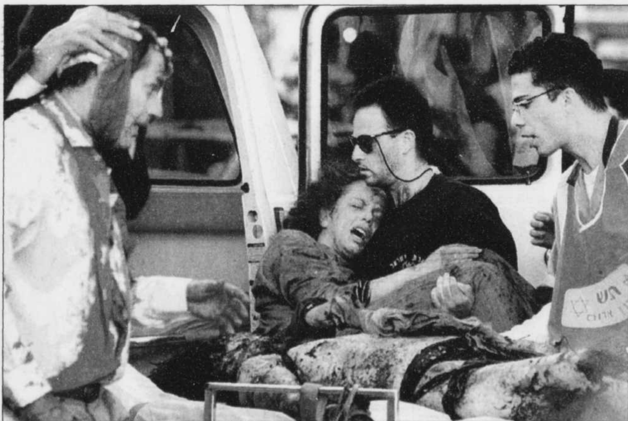
Des secouristes s'affairent à prêter main-forte aux blessés de l'attentat-suicide qui a fait au moins 13 morts et 125 blessés, devant le plus grand centre commercial d'Israël, à Tel-Aviv.

La chronique de Ghislaine Rheaume Page A5