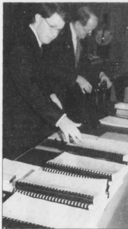
COLLABORATION SPÉCIALE, CLÉMENT ALLARD Des dizaines de documents ont été déposés à l'enquête du Conseil de la magistrature sur les plaintes portées à l'endroit du juge Jean Bienvenue.

Par la suite, le juge Bienvenue a participé à la rédaction conjointe d'un communiqué de presse. Dans son attitude, le juge Bienvenue n'a démontré aucune malice ni aucun antisémitisme, a répondu M. Sultan à Me Gabriel Lapointe, l'avocat du magistrat.