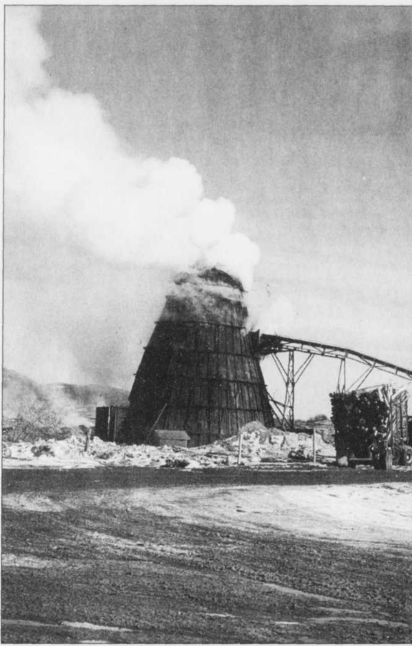
La combustion des résidus couvre souvent Nouvelle d'un épais nuage de fumée.

En principe, l'utilisation des brûleurs coniques devrait cesser en 1999. La rédaction technique de la révision du règlement sur la qualité de l'atmosphère est terminée, mais pas l'étape d'écriture juridique.