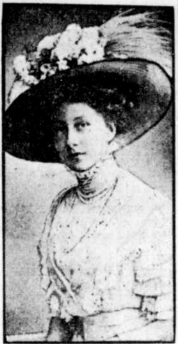
LA PRINCESSE VICTORIA-LOUISE, fille de l'empereur d'Allemagne, que son mariage avec le prince de Cumberland a faite reine de Brunswick.

Berlin, 26. — Le prince Ernest-Auguste de Cumberland et la princesse Victoria-Louise, fille du Kaiser, dont le mariage a eu lieu samedi matin, monteront bientôt sur le trône de Brunswick. Depuis 1854, il n'y a plus de descendants directs des souverains du duché de Brunswick. Vers un toast, au banquet d'Etat, samedi soir l'empereur Guillaume a dit qu'il voulait la réconciliation de la maison de Hanovre avec celle de Hohenzollern. Il exhorta le prince et la princesse à consacrer leurs vies au service de leurs futurs sujets et confirma par de jolis mots l'opinion générale que le mariage qui venait d'avoir lieu était un mariage d'amour. L'empereur ne parla qu'à deux personnes de sang royal. Les représentants diplomatiques, les ministres et autres invités étaient dans des salles adjacentes. La fameuse "danse aux flambeaux" fut le clou de la soirée. Elle suivit en tout point le cérémonial historique. A cette exception que les candelabres étaient portés devant la reine par douze pages, les ministres s'étant refusés de figurer dans un tel rôle. A la fin de l'imposante cérémonie du mariage, l'impératrice et la prin-