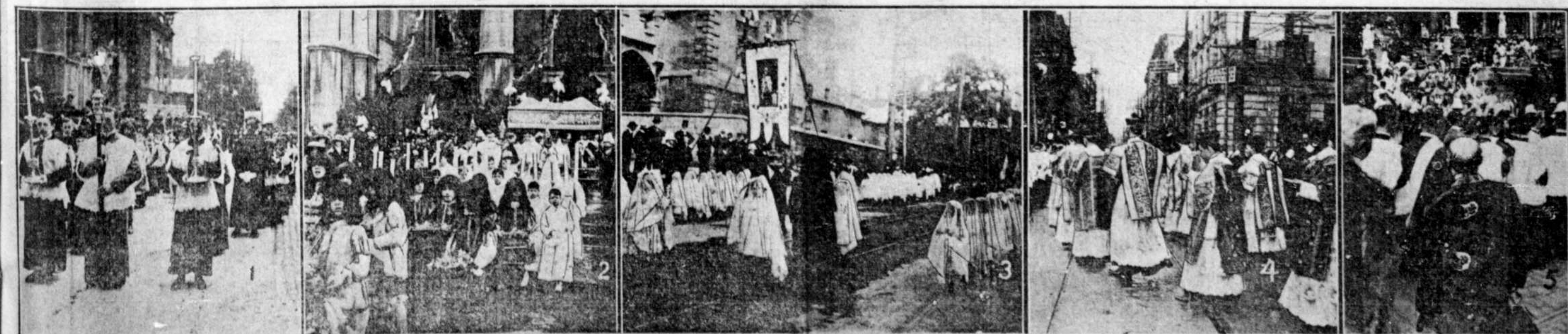
PROCESSION DE LA FETE-DIEU A MONTREAL. — 1. Commencement de la procession, les enfants de choeur au sortir de l'église Notre-Dame. — 2. Les petits pages jetant des roses sur le passage du Saint-Sacrement. — 3. Les premières communiantes de l'école Saint-Laurent, dirigées par la Soeur de la Congrégation Notre-Dame. — 4. Les membres du clergé, diacres et sous-diacres, précédant le dais. 5. Le reposoir à l'Université Laval. Après la bénédiction du Saint-Sacrement, le clergé redescendant pour continuer la procession. — Clichés du photographe de la "Presse."