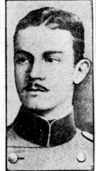
LE PRINCE ERNEST-AUGUSTE DE CUMBERLAND, que son mariage avec la fille de l'empereur d'Allemagne a fait monter bientôt sur le trône de Brunswick.

cesse Louise étaient en larmes. L'empereur montrait aussi les signes d'une émotion profonde. La cérémonie terminée, l'empereur, le prince et la princesse se rendirent à la gare en automobile et furent acclamés tout le long du parcours par une foule immense. Le prince et la princesse sont ensuite montés dans un train spécial, à destination de Hupertusstock, où se trouvent situés les terrains de chasse de l'empereur et où ils passeront une partie de leur lune de miel. L'empereur Nicolas est parti pour Saint-Petersbourg. On s'attend à ce que le roi George et la reine Marie restent encore quelques jours à Berlin. La cérémonie du mariage a été d'une splendeur inouïe et la présence de trois souverains très puissants en a rehaussé grandement l'éclat.