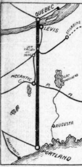
Carte indiquant le tracé proposé pour la route Québec-Portland. Elle va de Québec par le lac Mégantic à Portland.