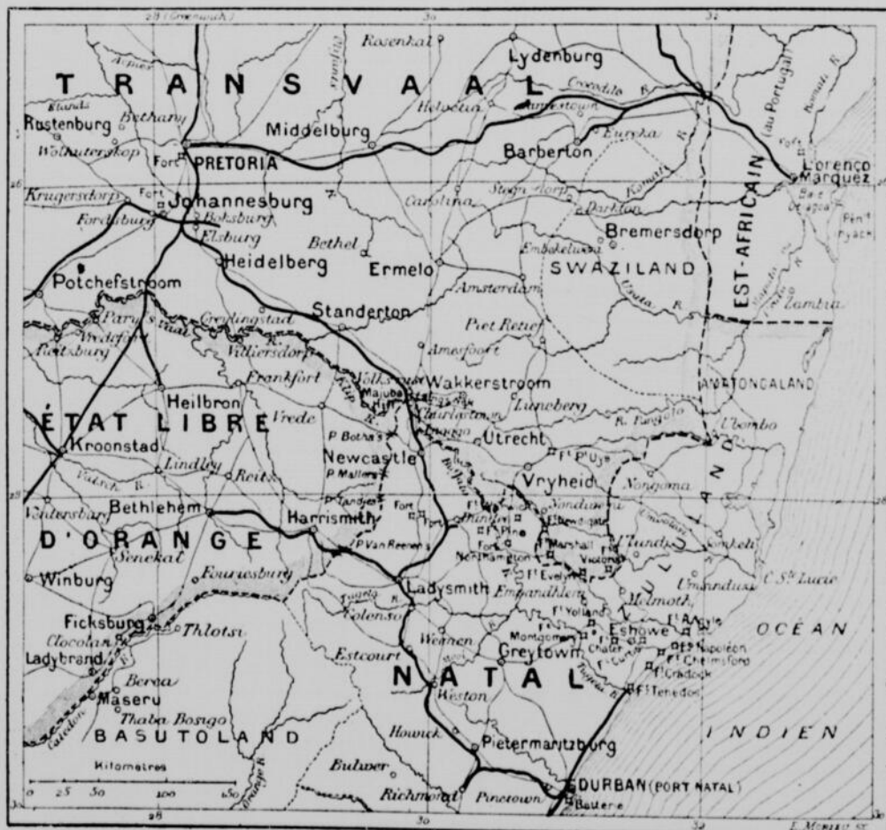
CAP DE NATAL, DE TRANSVAAL ET DE L'ORANGE

O vous qui n'êtes point insensibles à la voix du mendiant et qui laissez si volontiers tomber dans sa main l'aumône qu'il vous demande ! ô vous qui êtes émus à la seule voix d'un enfant qui pleure et qui auriez de si compatissantes consolations pour ceux que le malheur a frappés, n'aurez-vous pas un souvenir, pas une charité pour vos frères malheureux d'outre-tombe, frères d'autant plus malheureux qu'ils ne peuvent pas venir raconter eux-mêmes leurs souffrances ni mettre sous nos yeux le désolant spectacle de leur douleur !