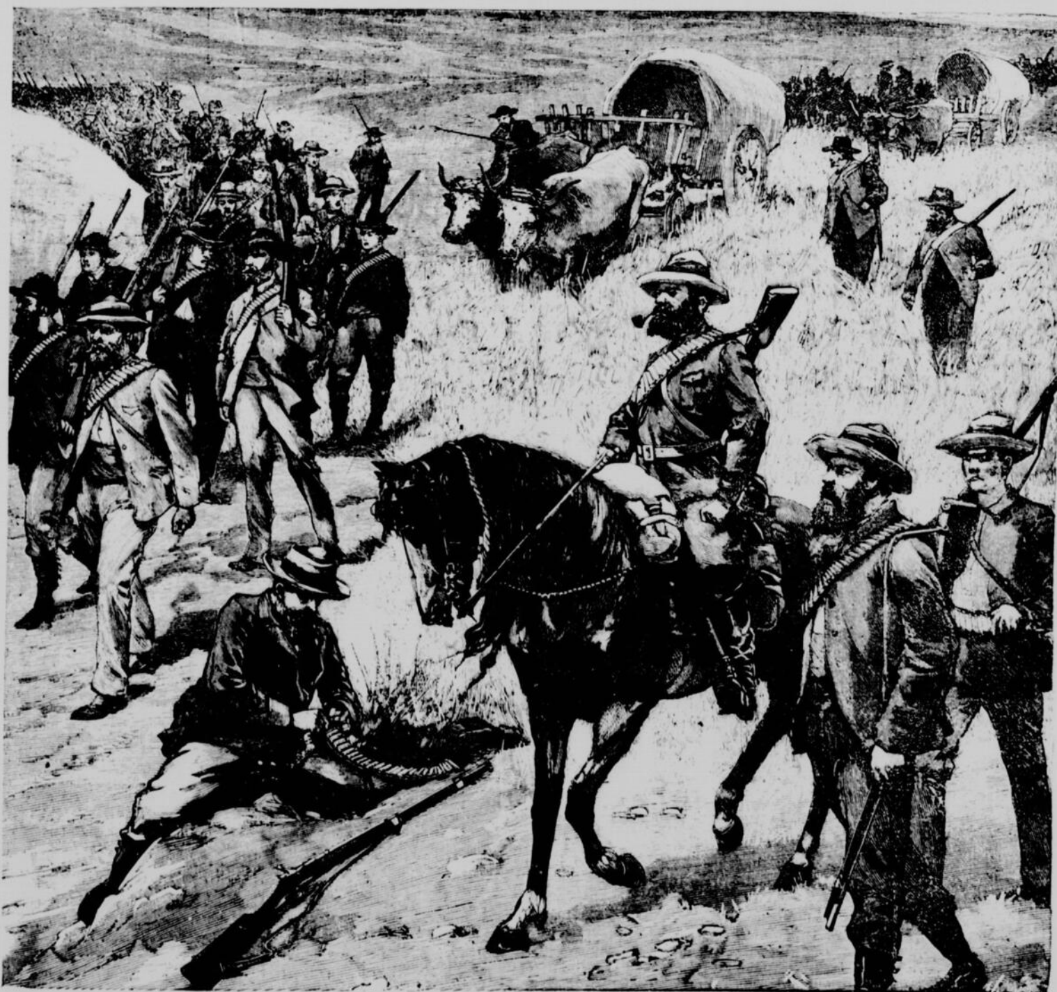
LA GUERRE AU TRANSVAAL.—Une troupe de Boers en marche vers la frontière