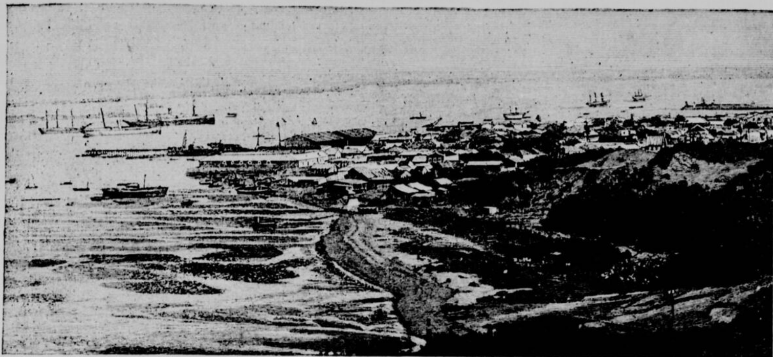
Vue de Durban (port Natal)