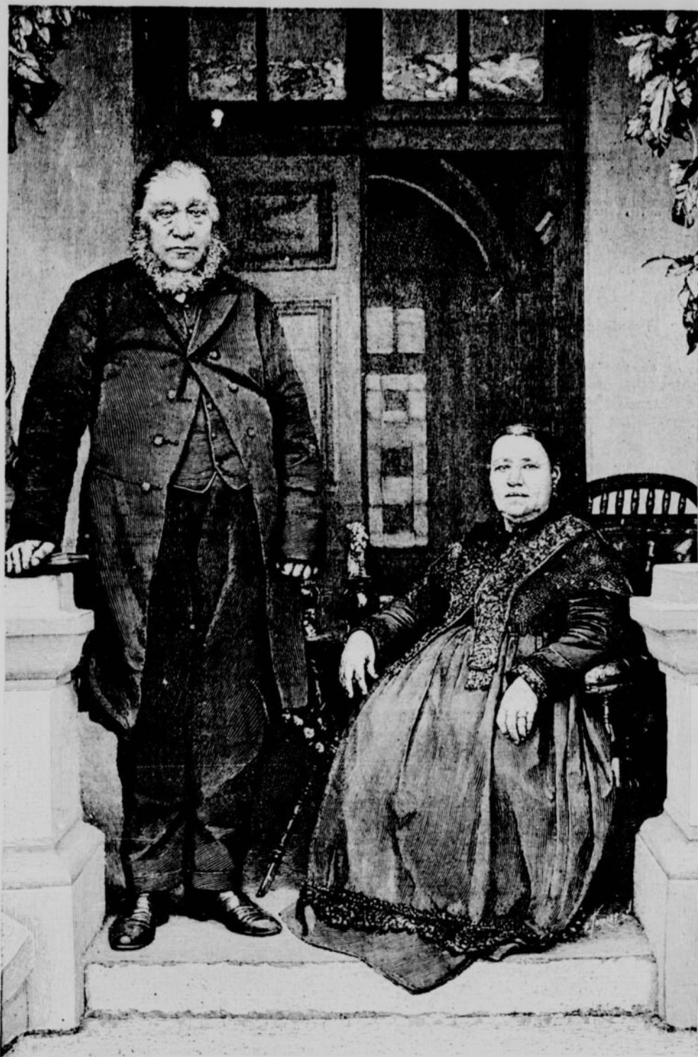
LE PRESIDENT KRUGER ET MME KRUGER, SUR LA PORTE DE LEUR RESIDENCE A PRETORIA