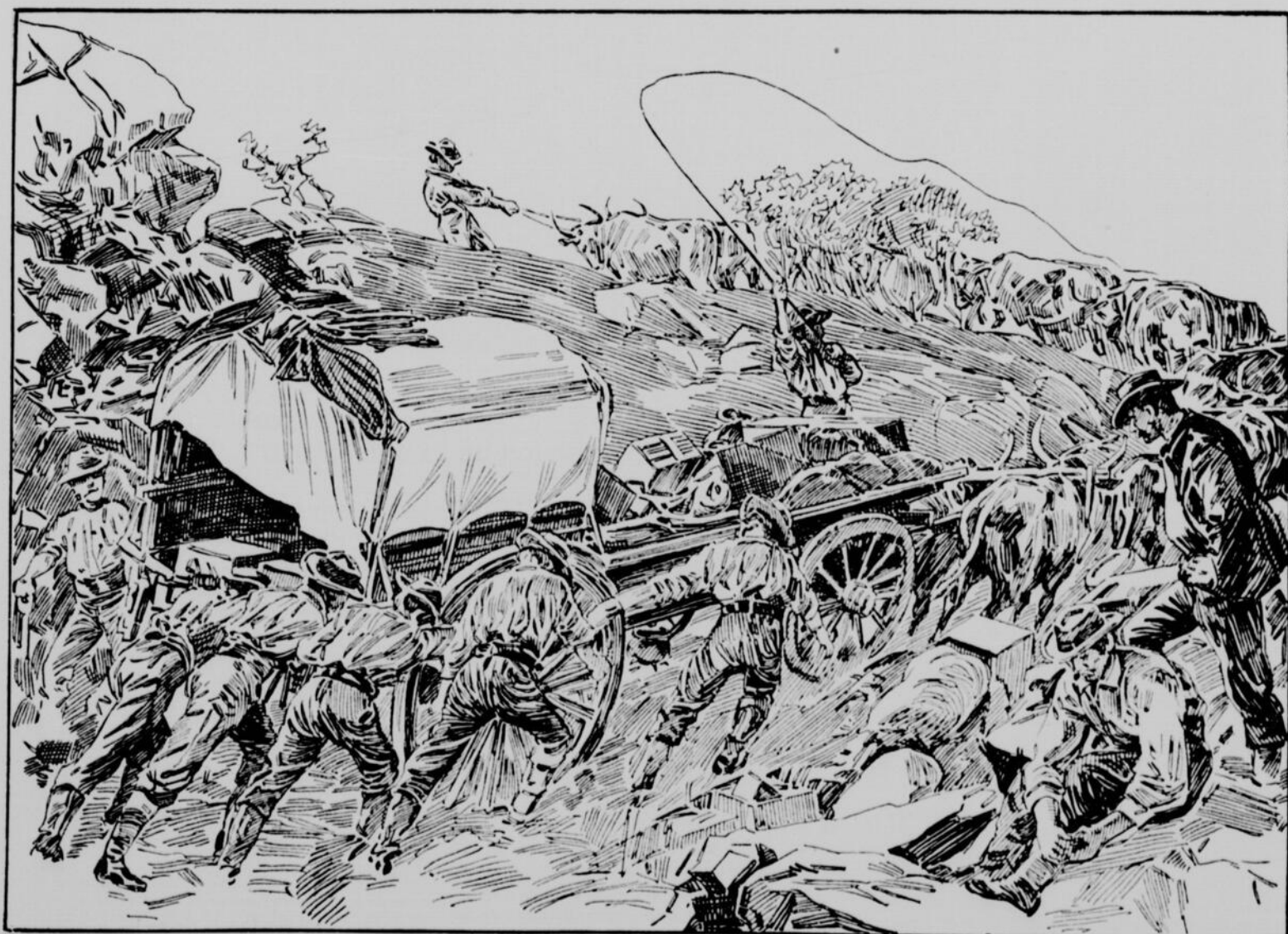
LA GUERRE AU TRANSVAAL. — Chariot de provisions et de munitions conduit à la frontière par les Boers