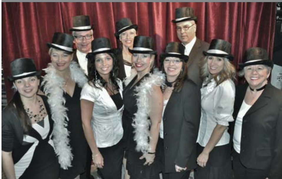
L'équipe de la Fondation au Gala des bénévoles