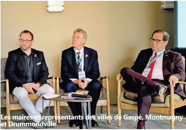
Les maires et représentants des villes de Gaspé, Montmagny et Drummondville