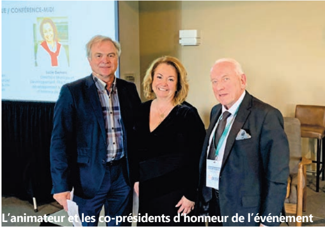
L'animateur et les co-présidents d'honneur de l'événement