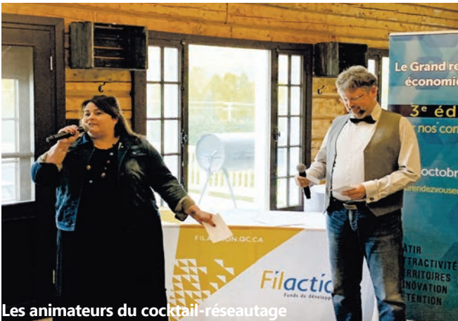
Les animateurs du cocktail-réseautage

La 3 e édition du Grand rendez-vous économique s'est avérée un succès ! Plus de 100 participants provenant principalement des Laurentides et de Lanaudière ont assisté aux conférences et panels tous plus captivants les uns que les autres. Les invités ont su capter l'attention et l'intérêt de l'auditoire par la pertinence de leurs propos sur les enjeux liés à la transformation démographique et à la préparation de la relève des entreprises familiales.