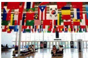
Courtier officiel en douanes et transport

Pour ne rien manquer de la saison des Festivals... Un Palais très branché sur sa ville à pied, en Bixi ou en transport en commun. [ suite ]