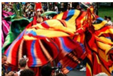
L'été à Montréal

Des congressistes venus des quatre coins du globe convergent actuellement vers Montréal, récemment consacrée première destination en Amérique du Nord pour l'accueil d'événements associatifs internationaux [ suite ]