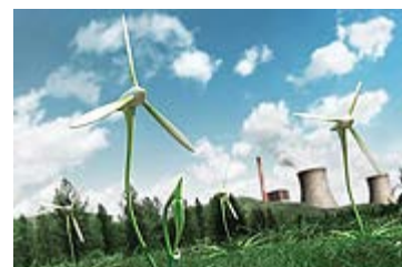
Un secteur porteur : l'Énergie