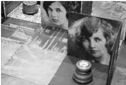
Photo : détail de l'installation Tendre le tissu du temps de Lise Vézina.

Le son d'une boîte à musique et un album de portraits anciens sont à l'origine de cette exposition élaborée autour d'une collection de boîtes musicales, de poudres et d'anciennes photographies. À cet assemblage d'objets féminins se greffent une série d'estampes exprimant l'insaisissable chez l'être humain et l'inéluctable passage du temps. Lise Vézina a exposé au Canada, en Colombie, à New York et en Europe. Ses œuvres font partie de collections privées et publiques. Vous serez touchés par son exposition pleine de sens et de poésie! Et, pour en apprendre davantage sur la démarche et les techniques de cette artiste fascinante, venez la rencontrer le 7 août prochain entre 10 h à 16 h... elle sera au Moulin pour partager sa passion avec vous!