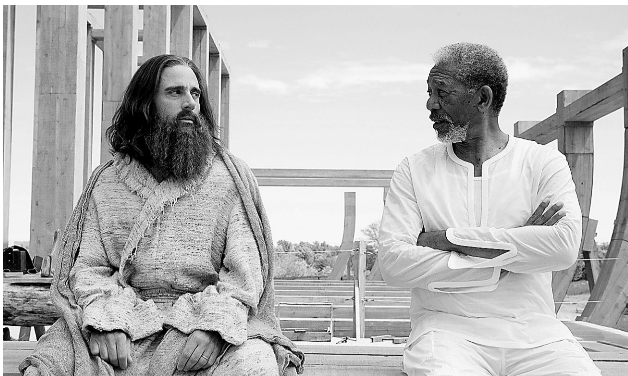
Steve Carell et Morgan Freeman sont les vedettes de la comédie Evan Almighty, qui prend l'affiche aujourd'hui.