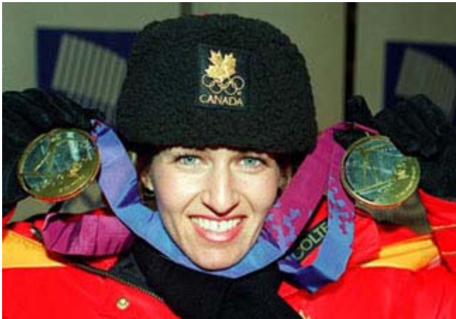
Myrian Bédard, championne olympique