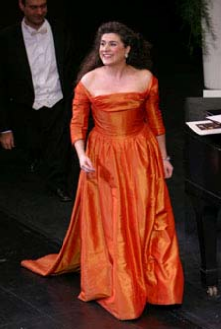
Cecilia Bartoli à New-York

Le Metropolitan Opéra de New-York a mis de l'avant plusieurs initiatives afin de diffuser sa programmation à un plus large public. Ainsi des concerts seront présentés en direct dans 28 salles des cinémas Cineplex au Canada dont quatre salles au Québec. Ce projet rejoint d'autres actions comme l'accès par la radio satellite ou sur le site internet du Metropolitan à certains concerts en direct et gratuits, une fois par semaine. Il faudra voir le résultat mais l'idée semble très séduisante.