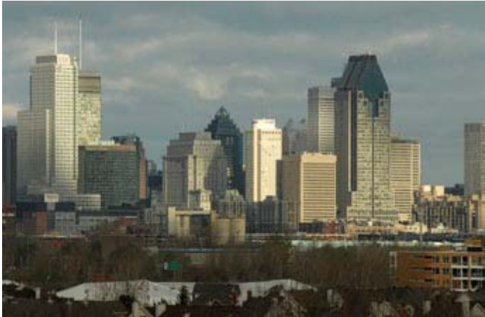
Montréal en attente de l'année 2007

L'année 2006 tire à sa fin et c'est l'occasion de faire un bilan. LeStudio1.com a fait le sien et la situation se résume à ceci. Nous commencerons en 2007 notre troisième année. Le magazine est à la fois une plate forme photographique et un weblog éditorial alimenté par l'équipe de collabrateurs. Au cours de la dernière année, nous avons discuté avec une quinzaine d'investisseurs afin de développer le projet en Europe et au Canada. Nous avons environ 35 000 lecteurs courriels et entre 1 000 et 2 000 visiteurs quotidiens sur le site Internet. Il serait possible d'augmenter ces chiffres par plusieurs centaines de milliers avec l'appui d'un partenaire convergent et avec l'usage de la technologie disponible. C'est une histoire à suivre... www.LeStudio1.com/Equipe