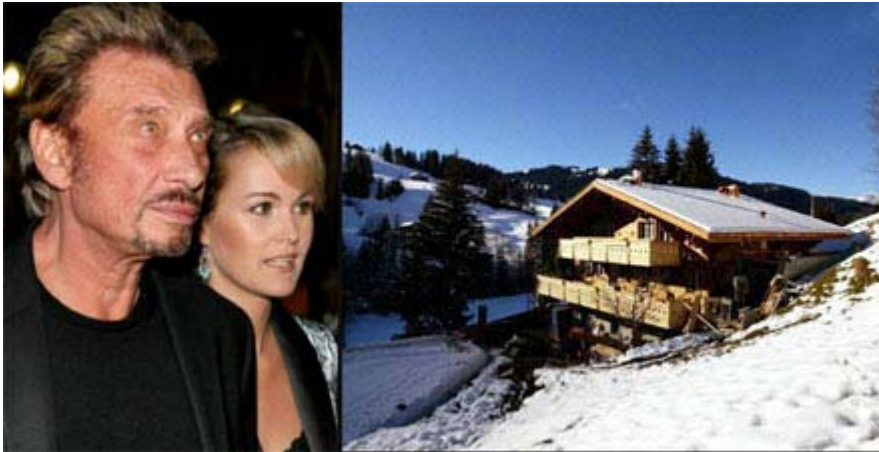
Johnny Hallyday et son chalet en Suisse