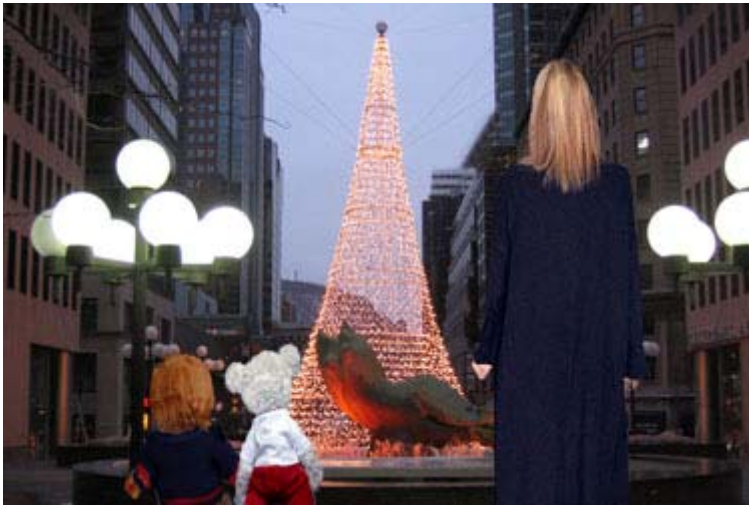
mademoiselle X et les deux mascottes, Monsieur X et sa soeur Miss Gym, devant l'arbre de Noël de Place Ville-Marie à Montréal.

«Quand on vient au monde, on est tous de la même couleur: violette.»