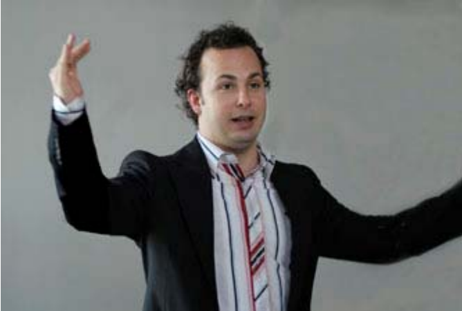
Yannick Nézet-Séguin

Le chef d'orchestre Yannick Nézet-Séguin a accepté le poste de directeur musical de l'Orchestre Philharmonique de Rotterdam dès septembre 2008. Ce mandat de quatre ans ne devrait rien changer au rôle que joue Séguin auprès de l'Orchestre Métropolitain du Grand Montréal avec qui il est sous contrat jusqu'au 31 août 2010. Les observateurs s'attendent à ce que Nézet-Séguin en vienne à quitter Montréal définitivement car il possède un talent international. Certains avaient mentionné son nom pour succéder à Charles Dutoit mais son jeune âge (31 ans) aurait joué en sa défaveur.