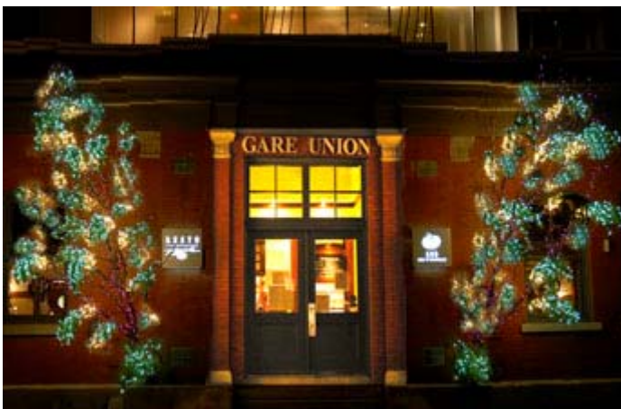
Restaurant Pizzaiolle Montréal

Les décorations des fêtes sont une coutume internationale. Que l'on soit à Montréal ou à Shangai, les gens aiment tous orner de