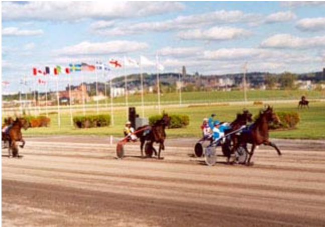
Hippodrome de Montréal

Les courses de chevaux font à nouveau l'objet d'un scandale au Québec alors que l'on accuse les anciens dirigeants (SONAC) d'avoir profité de leurs postes d'une manière exagérée sur le plan des comptes de dépenses. Cela n'est pas pour embellir la réputation de l'industrie des courses de chevaux que l'on dit être d'une autre époque et que plusieurs voudraient tout simplement voir les pistes de courses fermées. L'acheteur des quatre pistes du Québec, le sénateur Paul Massicotte veut relancer cette industrie et la rendre plus accessible. Cette course est loin d'être gagnée! (Voir éditorial de l'éditeur) www.LeStudio1.com/Editeur