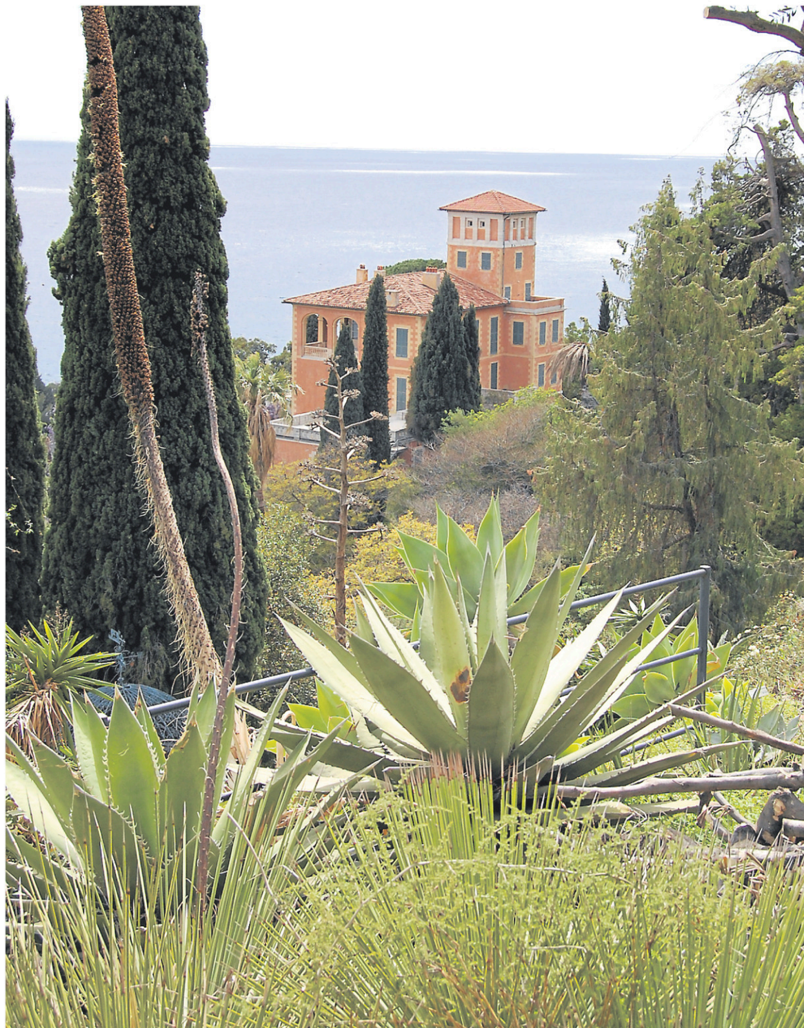
La ville de Vintimille est célèbre pour son marché en bord de mer ainsi que pour son vaste jardin botanique.

— PHOTOS LA PRESSE, JEAN-THOMAS LÉVEILLÉ