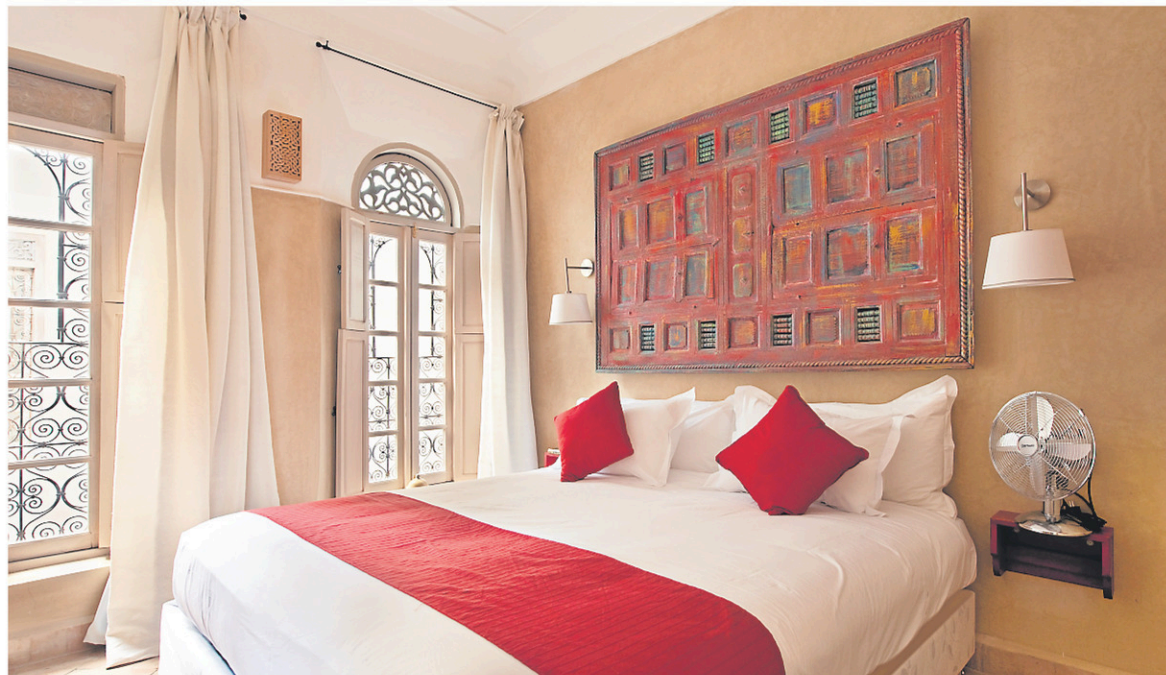
À cinq minutes à pied de la Porte Bleue, le riad Anata ne compte que cinq chambres.