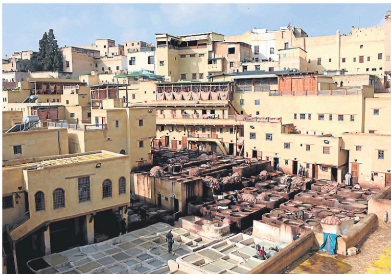
Une des nombreuses tanneries que l'on retrouve dans la médina.

Allée de palmiers, vaste promenade bordée d'orangers et tapissée de galets, fontaines, bamboueraie, cèdres et eucalyptus, petit lac au fond, Jnane Sbile est une oasis d'air pur et de parfums. Option plus «bourgeoise» : l'hiver pour skier, l'été pour se rafraîchir, c'est Ifrane ou «la petite Suisse du Maroc». À 40 minutes de Fès et à 1730 m d'altitude dans le Moyen Atlas, c'est une cèdreraie, une rivière et des chalets alpins...Vision hallucinante que ce village bâti en 1929 par les Français.