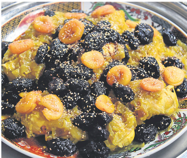
Tagine de poulet aux pruneaux et aux oignons