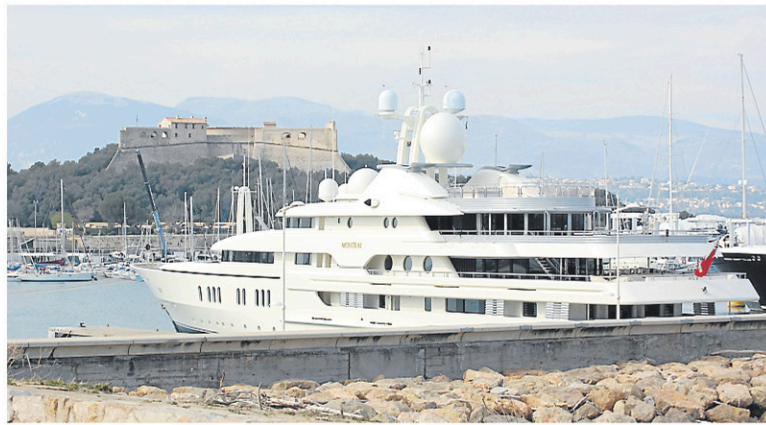
Le quai d'Antibes accueille des yachts appartenant à des milliardaires.