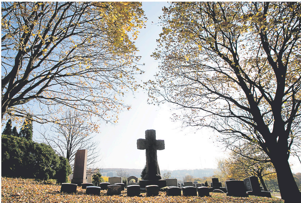
Le parcours d'environ trois heures se termine au cimetière Mont-Royal, où se trouvent les tombes et les pierres commémoratives de six passagers décédés lors du naufrage du Titanic .

Le parcours déambulatoire se conclut au cimetière Mont-Royal, là où se trouvent les tombes et les pierres commémoratives de six passagers morts durant le naufrage. Avec les cinq autres passagers enterrés dans le cimetière Notre-Dame-des-Neiges et celui qui se trouve au cimetière Baron de Hirsh, Montréal est au