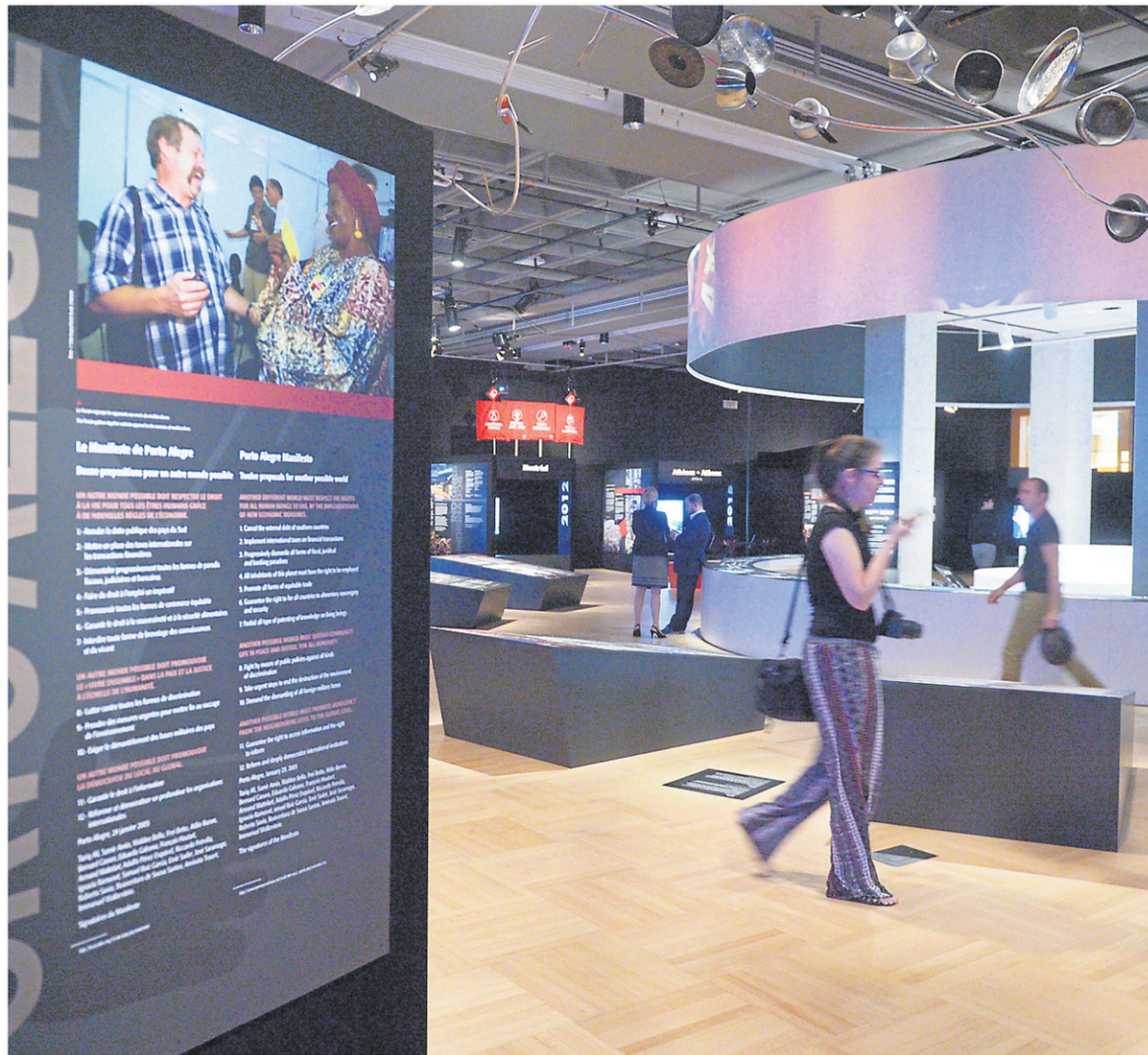
Le temps de visite moyen au Musée de la civilisation de Québec est de deux heures.