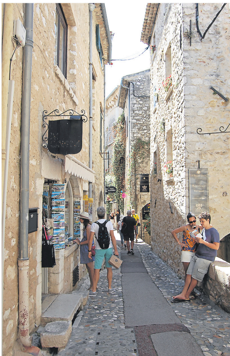
Le village fortifié de Saint-Paul-de-Vence est réputé pour ses galeries d'art.