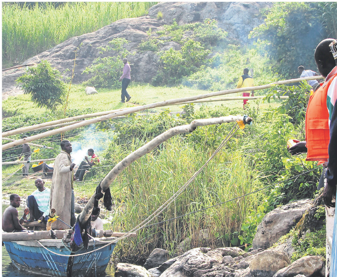
Le bateau est un moyen de transport très populaire sur le lac Kivu.

Un homme a refusé de bouger pour que je m'assoie à ses côtés. Aussitôt, un autre m'a offert une