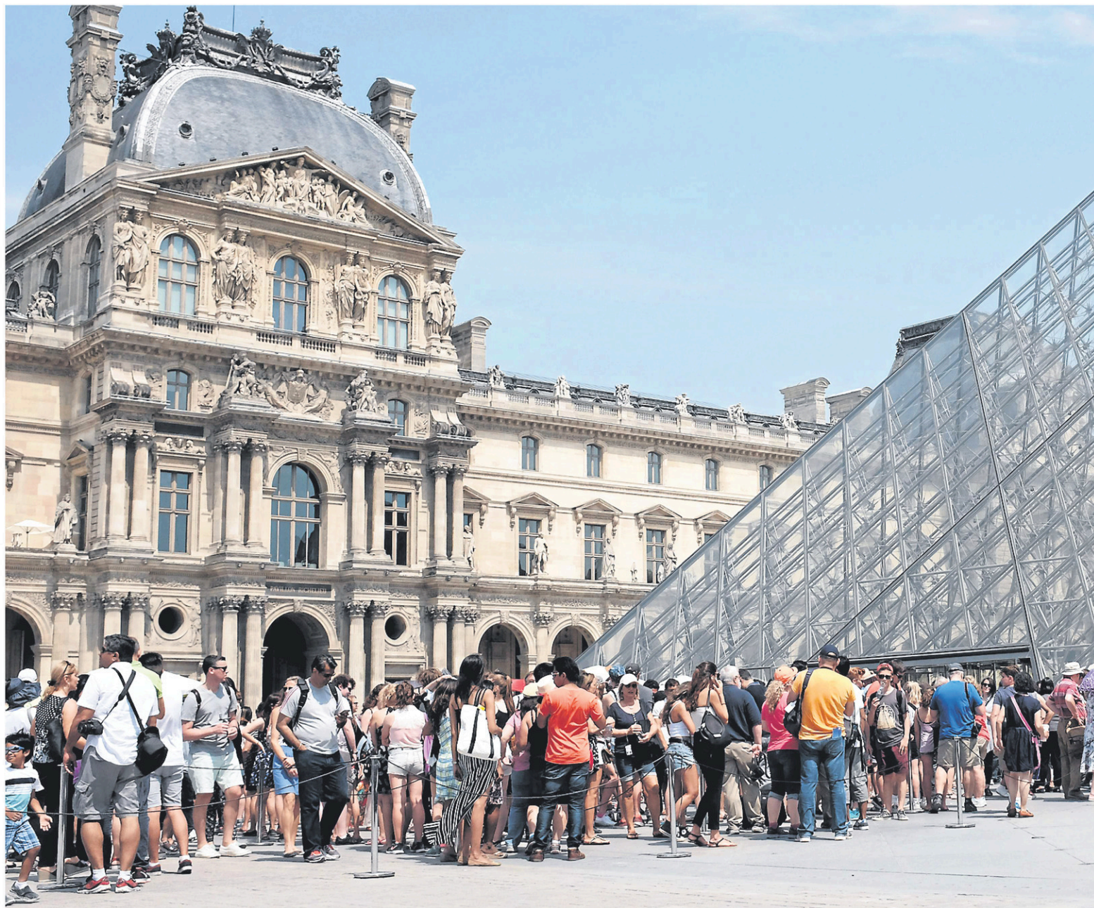
Le musée du Louvre a modernisé ses installations en 2015 afin de continuer d'attirer des milliers de touristes et de visiteurs de passage à Paris.