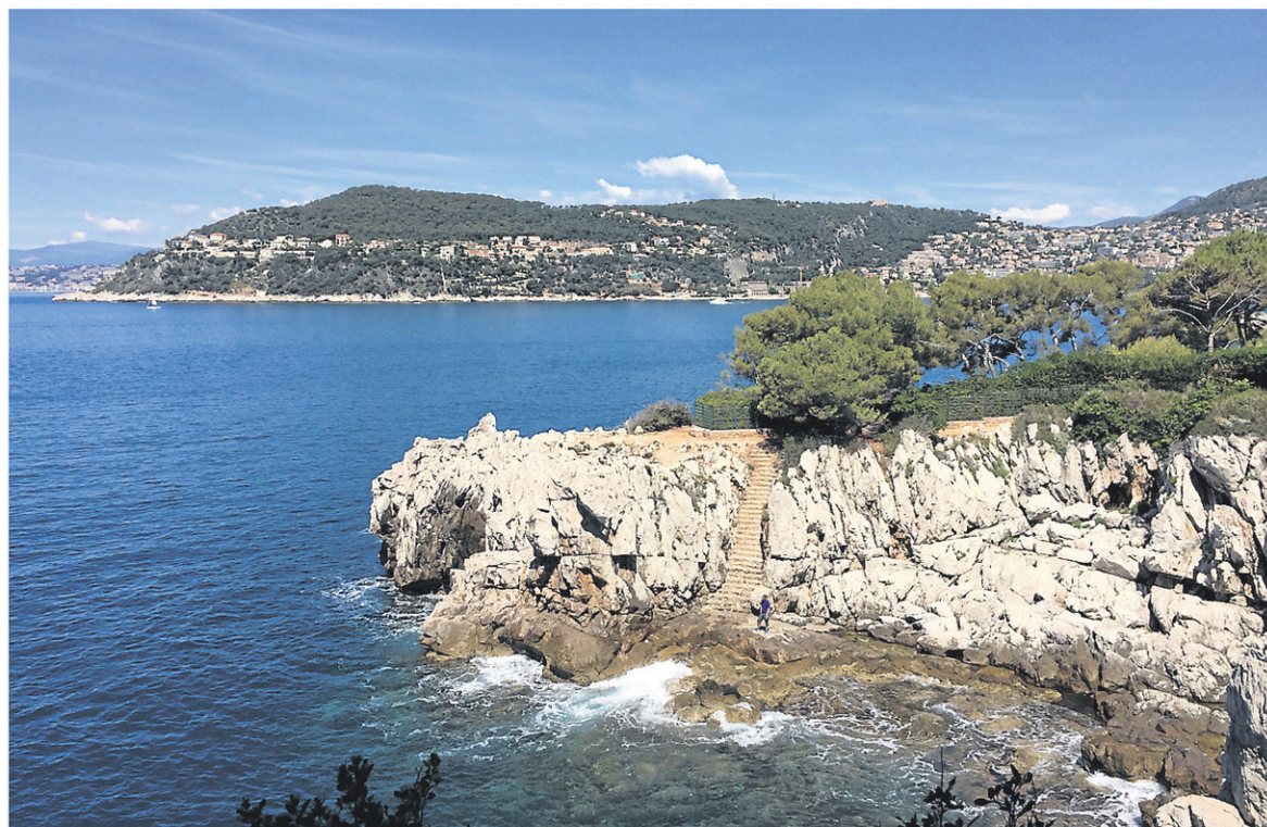
Un sentier de sept kilomètres permet de faire le tour de la presqu'île de Saint-Jean-Cap-Ferrat et d'accéder à de nombreuses criques où il est possible de se tremper les orteils dans la Méditerranée.