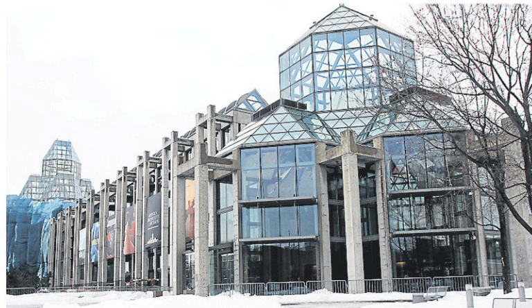
Le Musée des beaux arts du Canada est situé à Ottawa.