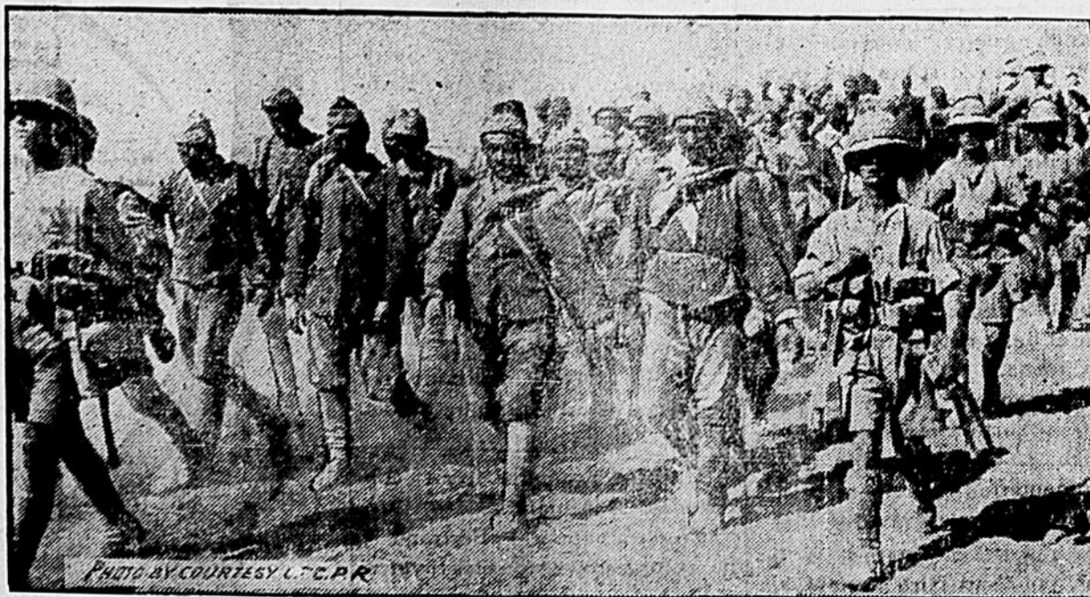
Soldats turcs faits prisonniers par les Anglais, en route pour un camp de concentration.