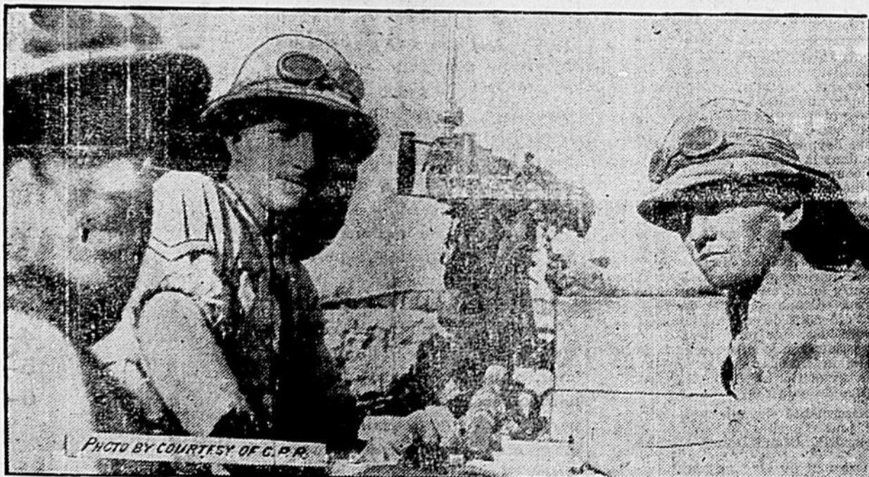
Une mitrailleuse et ses servants.