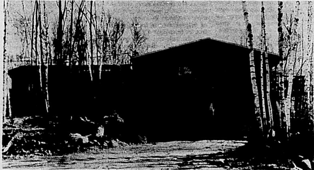
Un des immeubles de la Station de Biologie de Saint-Hippolyte, près du Lac-en-Coeur, à 50 milles au nord de Montréal.

Prof. Rouleau: Taxonomie végétale de Terre-Neuve et du Québec. Flore de l'Est du Canada.