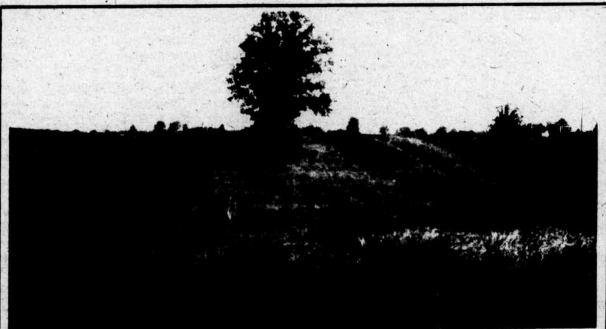
Le quartier d'Angers: Présentement, il est loin d'être considéré comme "un endroit rêvé" par les développeurs!