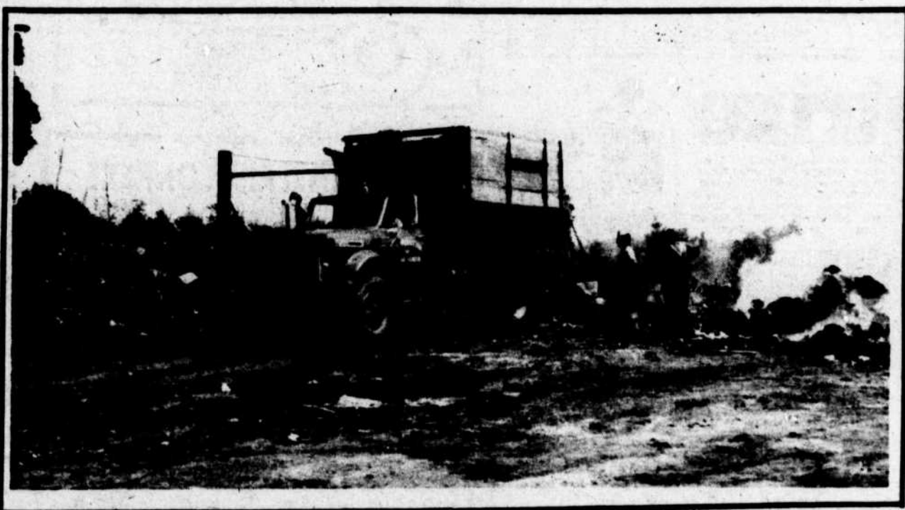
Quand on est "regroupé", on partage TOUT.... jusqu'aux dépotoirs !

Ainsi, le terrain de déchargement appartenant aux buckinghamois recevra la visite d'un groupe d'étrangers au moins une fois la semaine.