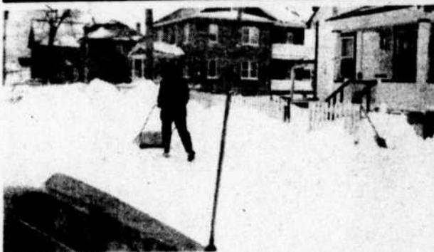
La tempête de neige.

A cet effet, il semble indispensable que les jeunes su- bissent des examens, notamment aux principales par- ties du corps en fonction lors des mois scolaires. Ainsi, est-il nécessaire que LA VUE des enfants soit dans un état parfait avant d'entreprendre la prochaine saison. Malgré les rapports fréquents des oculistes qui rappel- lent, avec preuve à l'appui, que plusieurs élèves "per- dent" en quelque sorte plusieurs mois, voire même une année entière à cause d'une faible vue, il demeure que plusieurs croient encore que de telles choses ne peu- vent arriver qu'aux enfants du voisin. Pour cette raison, l'Institut National Canadien pour les aveugles vient de lancer une campagne nationale, avertissant les popu- lations que des milliers d'enfants d'âge scolaire ont be- soin de soins aux yeux. On prédit même que quelques- uns d'entre eux qui n'ont pas les traitements nécessaires deviendront aveugles. De là l'école la né- cessité urgente de faire examiner la vue de vos en- fants avant la prochaine année scolaire.