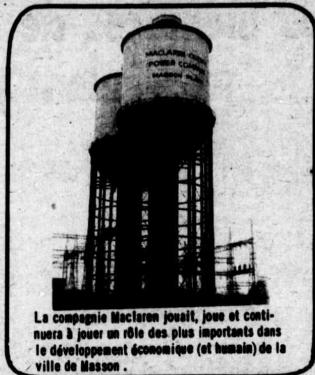
La compagnie Maclaren jouit, joue et continuera à jouer un rôle des plus importants dans le développement économique (et humain) de la ville de Masson.

Notons que certaines normes de zonage dans les zones