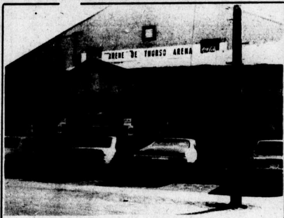
L'aréna de Thurso. On va-t'y la rénover ou on va-t'y pas la rénover ?

La secrétaire a, par la suite, fait savoir que cet emprunt occasionnerait une augmentation du taux de taxe pouvant varier de $1.50 à $2.50; tout semble indiquer que les gros bonnets de la corporation de la ville de Thurso favoriseront un emprunt à long terme (remboursement du capital et des intérêts au bout de 30 ans.)