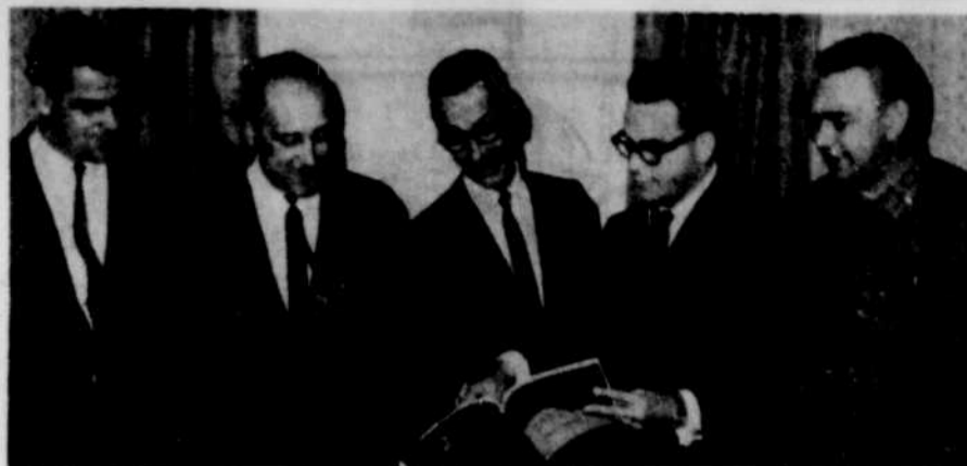
CHAMBRE DE COMMERCE — Quelques membres du conseil de la Chambre de commerce étudient attentivement une épreuve de la brochure touristique présentant les villes frontalières aux touristes.