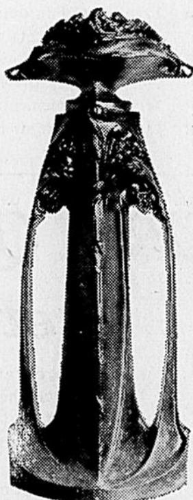
Portraits de l'artiste français Hector Gri-mard et vase dessiné par ce même artiste. Peut-être admiré à la Art Gallery de Toronto, en exposition permanente.