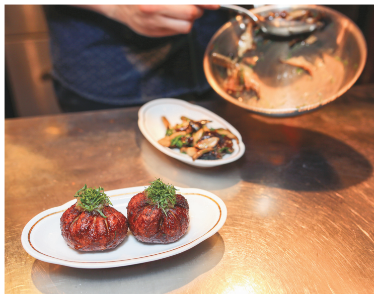
M. WELLS STEAKHOUSE

Comme le chef cultive aussi l'exotisme cher au cœur des gens de sa région natale, il a installé son intriguant éta-