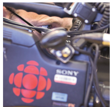
JACQUES NADEAU LE DEVOIR Les bulletins régionaux de Radio-Canada passeront d'une heure à trente minutes.