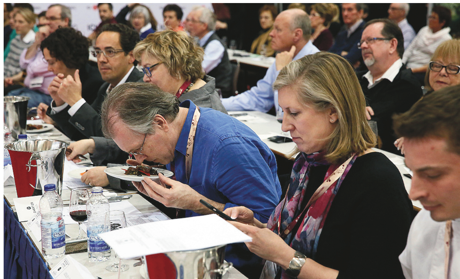
Le chroniqueur (penché) en plein travail

Résultat des courses? Ceux qui croyaient vaine la possibilité d'harmoniser un plat salé apprêté avec du cacao avec un vin