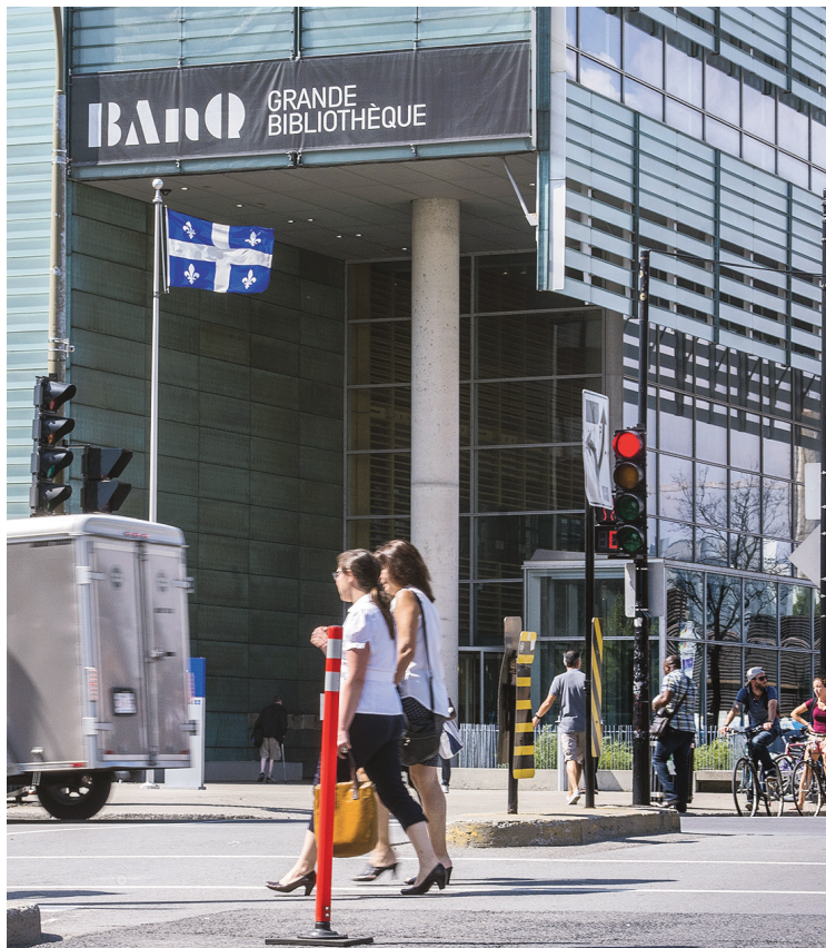
MICHAEL MONNIER LE DEVOIR

Par ailleurs, dans le dépôt des crédits survenus jeudi à