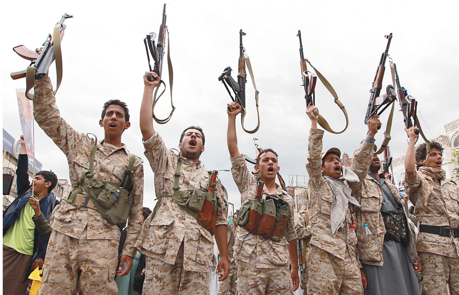
Des Yéménites près des Houthis brandissaient leurs armes jeudi à Sanaa.

La possibilité d'un cabinet comprenant des travaillistes refait surface