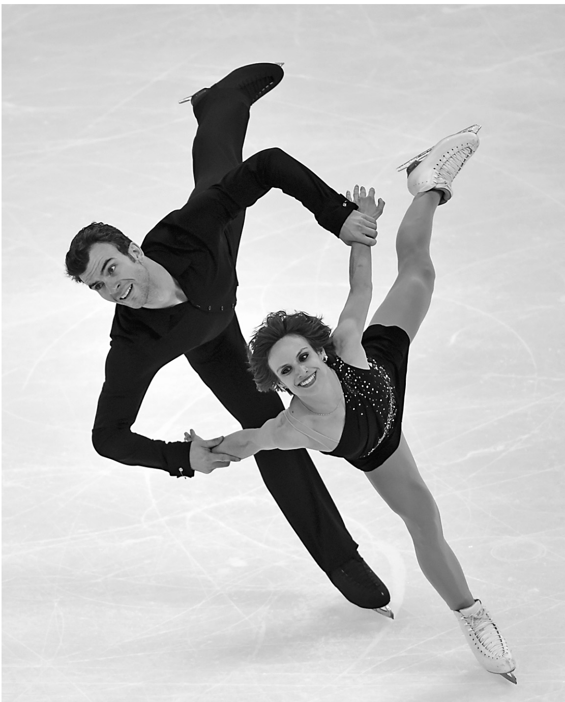
Eric Radford et Meaghan Duhamel durant leur programme libre