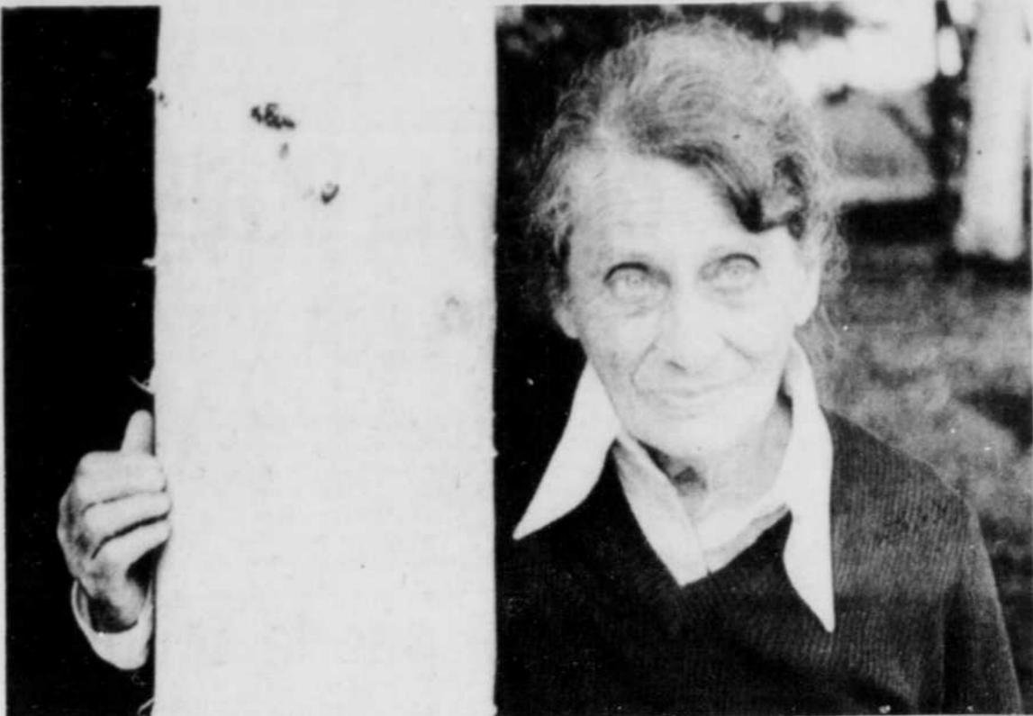
Depuis 4 ans et jusque avant sa mort, Gabrielle Roy s'affairait à rédiger ses mémoires. L'oeuvre reste inachevée.