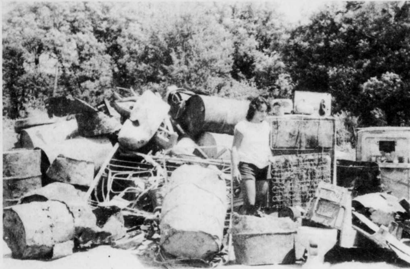
Une foule de débris ont été retirés du lit de la rivière, parmi ceux-ci les restes d'une motoneige portant encore une plaque d'immatriculation. Le pollueur a ainsi laissé un indice qui pourrait permettre de le retracer...