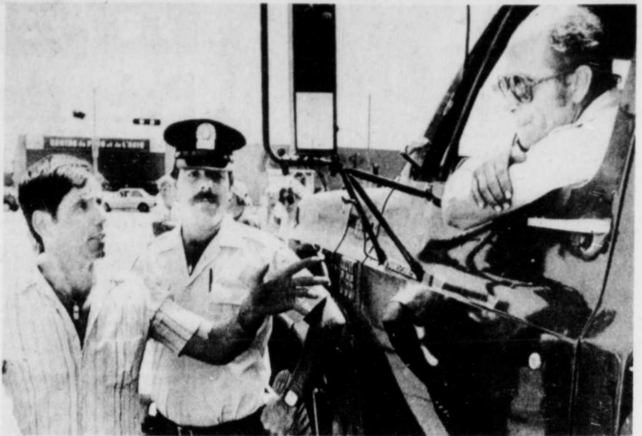
Les policiers ont dû intervenir pour permettre de la compagnie après qu'il ait reçu la façon de au camionneur indépendant de quitter la cour penser d'un des employés de Maislin.

Le président du syndicat, Gaétan Morin, a précisé que les 275 employés, représentés par le local 106, rempliraient les formules des syndicats et que leurs représentants seront présents à l'assemblée des créanciers, prévue pour le 17 août.