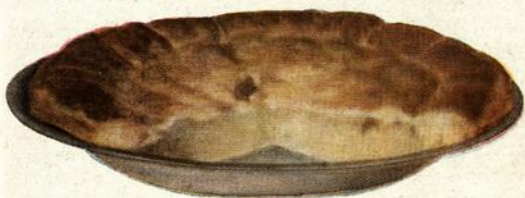
Pâté au “Coconut”