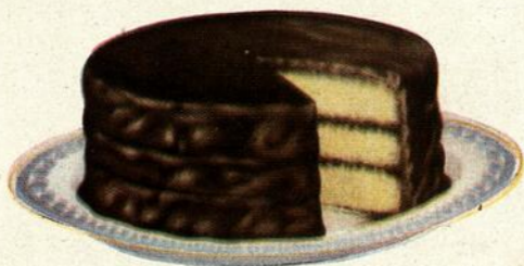
Gâteau glacé au chocolat