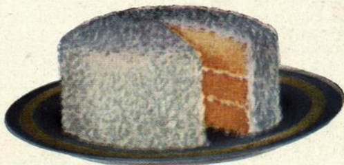
Gâteau au coco