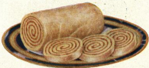
Gâteau éponge avec confiture