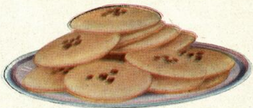
Galettes garnies aux raisins