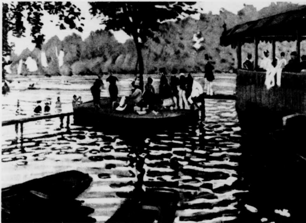
"La Grenouillère" — 1869 (Claude Monet)