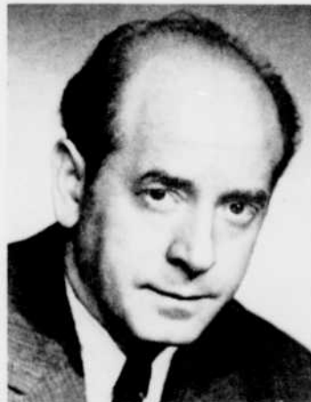
EUGENE ORMANDY dirigera l'Orchestre de Philadelphie dans la Symphonie no 5 de Sibelius, à l'émission Concert, lundi à 11 h. 10.