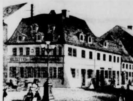
La maison natale de Schumann à Zwickau.