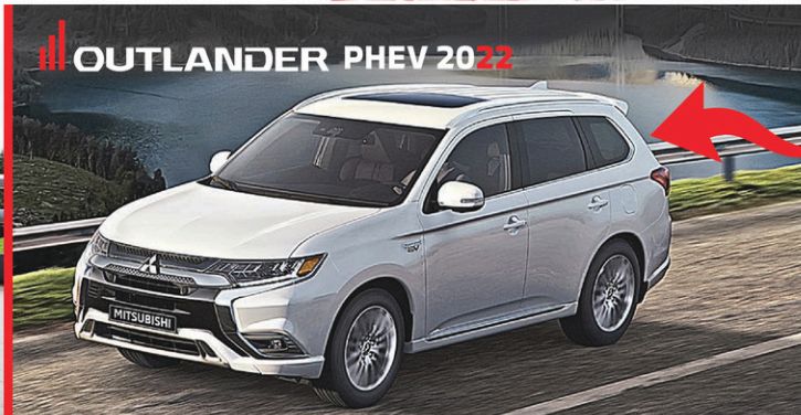
OUTLANDER PHEV 2022