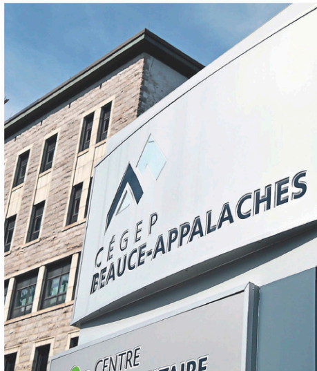
C'est la fin des cours à la maison pour les cégepiens et les universitaires.

Les activités parascolaires, y compris les activités sportives, seront permises dans l'ensemble des établissements. L'objectif gouvernemental