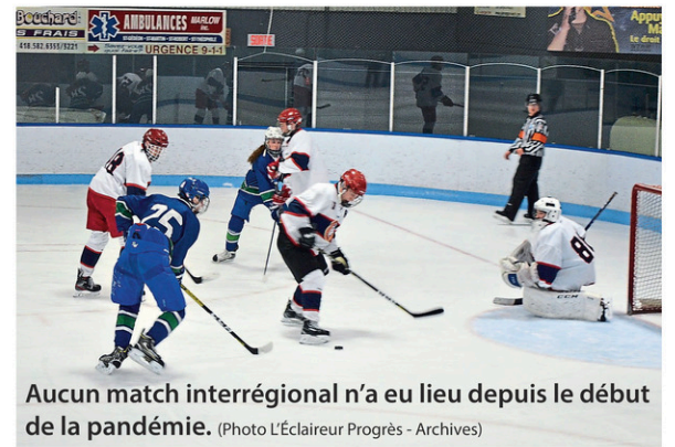
Aucun match interrégional n'a eu lieu depuis le début de la pandémie.

Gilles de Blois, président de Hockey Estrie,