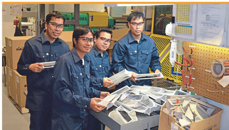
Sur une base temporaire ou permanente, des employeurs de la région font appel aux travailleurs étrangers.

Ces mesures ont entraîné des perturbations aux chaînes d'approvisionnement et de longues files d'attente pour les voyageurs et transporteurs commerciaux entrant au Canada.