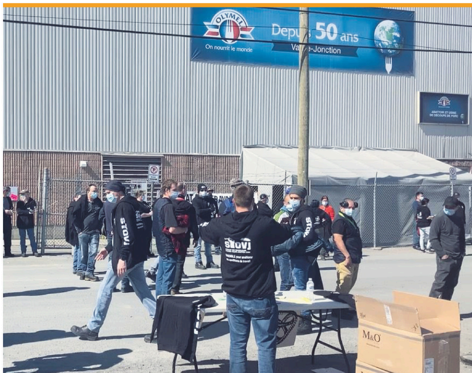
Le conflit perdure chez Olymel à Vallée-Jonction, les deux clans étant loin de partager la même vision.