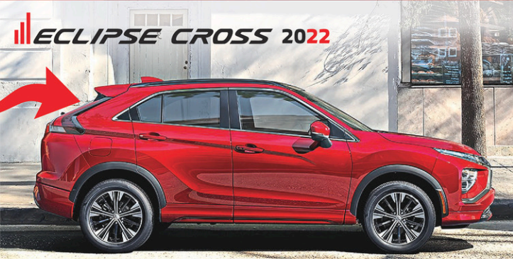
ECLIPSE CROSS 2022

93$*** /semaine à 1,99% d'intérêt pendant 84 mois