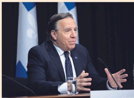
Le premier ministre François Legault.

Le passeport vaccinal pourrait ainsi permettre l'accès sans restriction à certains services, comme les salles de spectacles et les