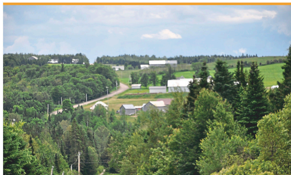
Le CRECA veut connaître vos préoccupations environnementales.

La ministre indique cependant que des mesures particulières pourraient être prises pour les établissements où la couverture vaccinale serait insuffisante.