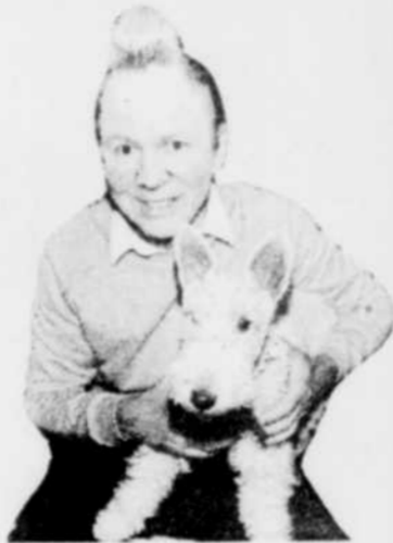
Règlements sur demande.

Courez la chance de gagner un coffret d'albums des aventures de Tintin, offert par les Éditions Casterman, ou 2 billets pour Bruxelles sur les ailes de Sabena, lignes aériennes belges.