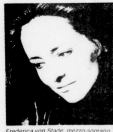
Frederica von Stade, mezzo-soprano