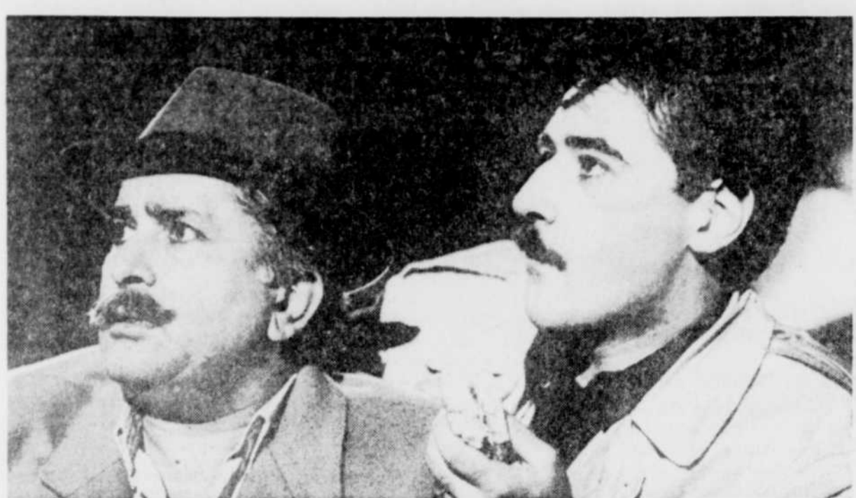
Dans le film de Stephen Frears, Shashi Kapoor et Ayub Khan Din jouent le père retrouvant son fils dans un Londres bien différent de celui qu'il a connu, étudiant.

C'est ce qu'on pourrait qualifier de film éclaté. Frears et son scénariste Hanif Kureishi, avec qui il a fait My Beautiful Laundrette , tirent dans toutes les directions et ce n'est que grâce à un montage alerte que le film conserve une certaine cohérence. C'est joué avec beauté par tous les comédiens, aussi bien Frances Barber ( Z.O.O. de Peter Greenaway) dans le rôle de Rosie, que Ayub Khan Din dans celui de