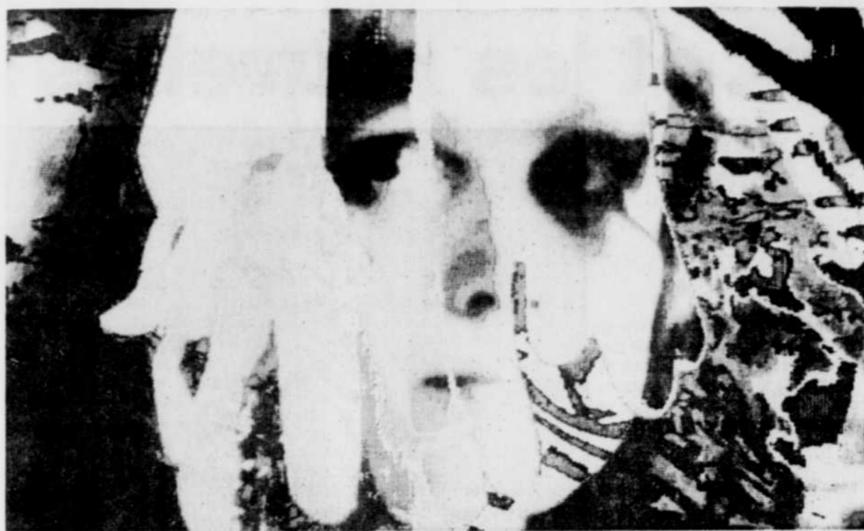
Une image de synthèse de l'Américaine Joan Truckenbrod.

Sensibles aux désirs du public dont ils dépendent tant, les organisateurs ont d'ailleurs révisé la scénographie de l'exposition cette année, car des personnes se plaignaient de vite se sentir désorientées parmi la profusion de stands. Résultat: autant d'oeuvres sont présentées, mais le circuit de la visite, plus