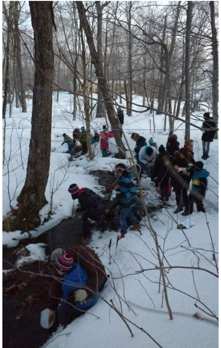
Cueillette de l'eau de Pâques du 27 mars dernier.