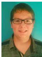
Par Sébastien Lapierre Administrateur à la CDI Saint-Victor