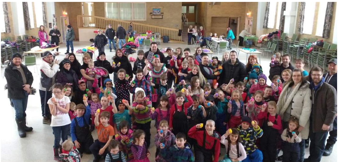
Chasse aux cocos du 26 mars dernier à l'Aube Nouvelle.