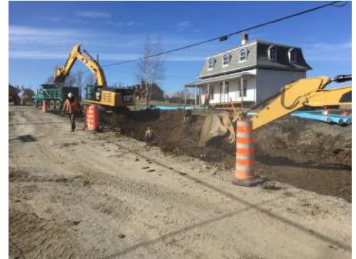
Photos : Travaux sur la rue Commerciale / Rang 3 Sud menant au Lac Fortin