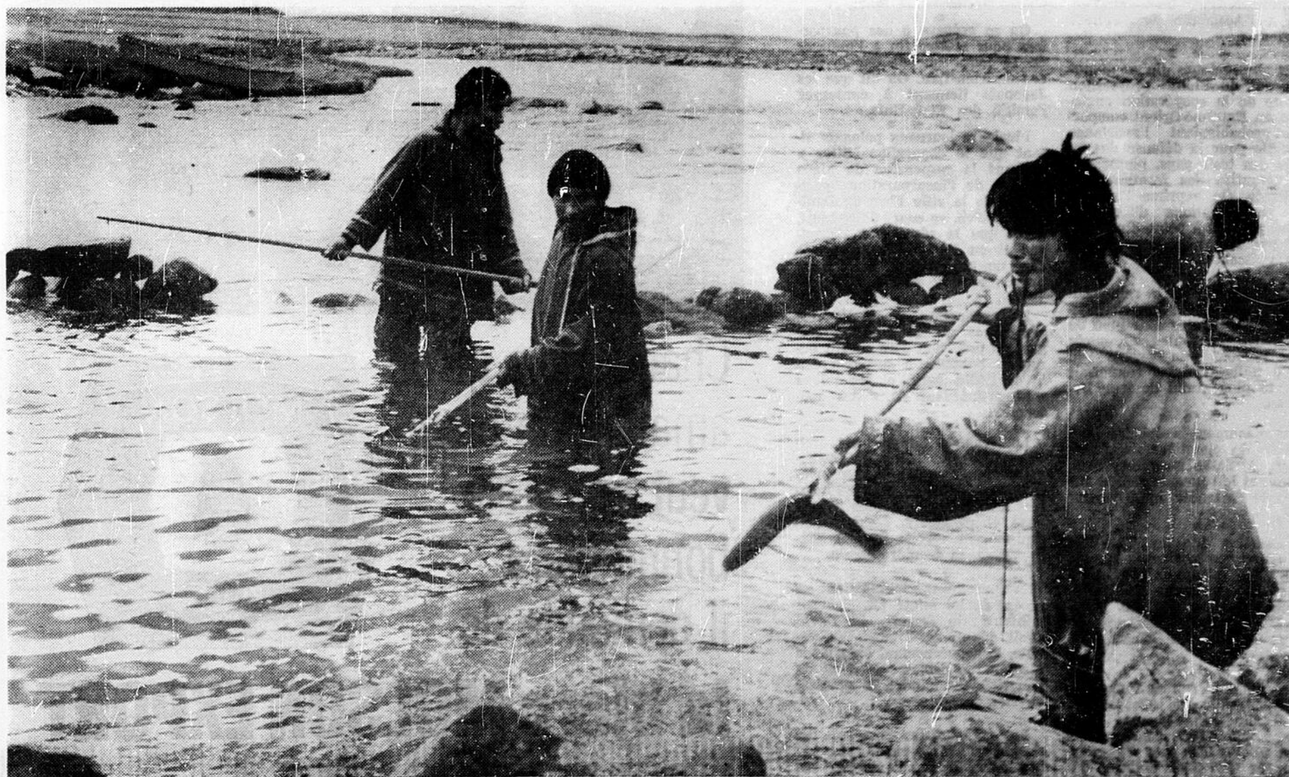
La saison de l'omble est courte, environ un mois. C'est pourquoi au temps de la montée des poissons, tout le monde travaille à une allure folle. Ce poisson délicat, à la chair rose tendre, s'apprête à peu près comme le saumon.