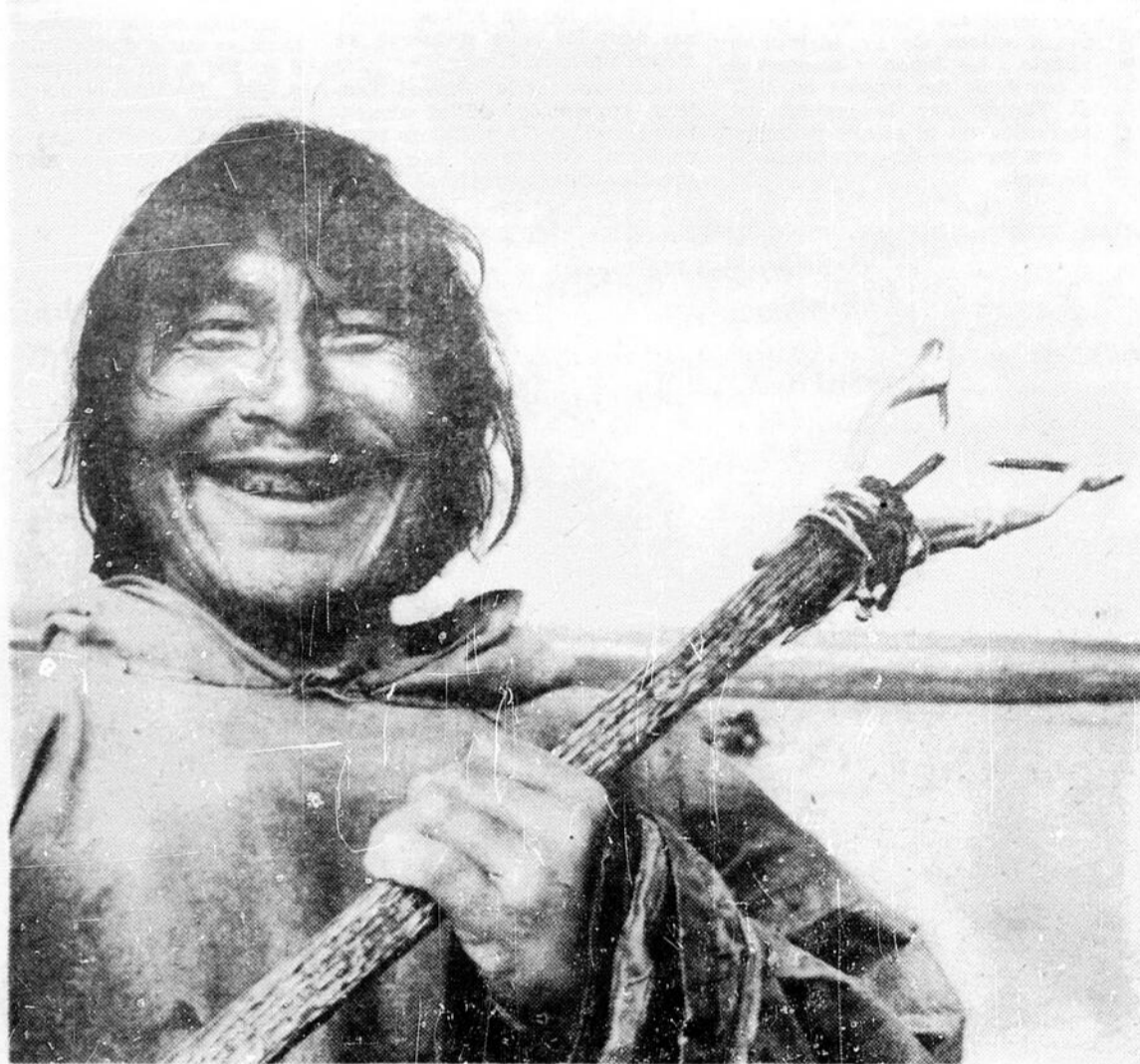
C'est avec cet instrument à hameçons bien particuliers que l'Esquimau pêche l'omble arctique, un mets choisi qui fut servi sur les tables des grands dîners d'Etat.