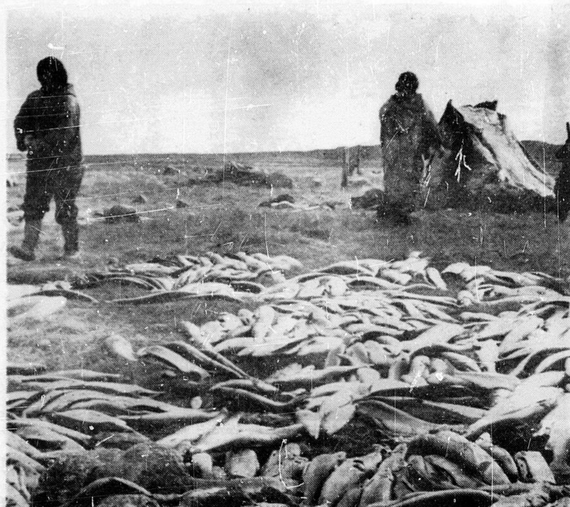
Le principal marché de l'omble arctique au cours des dernières années se trouvait dans l'est du Canada. En 1961, l'exportation commença vers les E.-U. et outre-mer.

Si l'on peut trouver le moyen de généraliser les petites opérations de pêche sur une grande partie du Grand Nord, il semble que l'avenir de l'omble arctique soit prometteur. On sait que ce poisson du Nord est rapidement devenu un grand favori sur les menus des grands hôtels et des restaurants réputés, tant au Canada, aux Etats-Unis que sur les tables européennes.