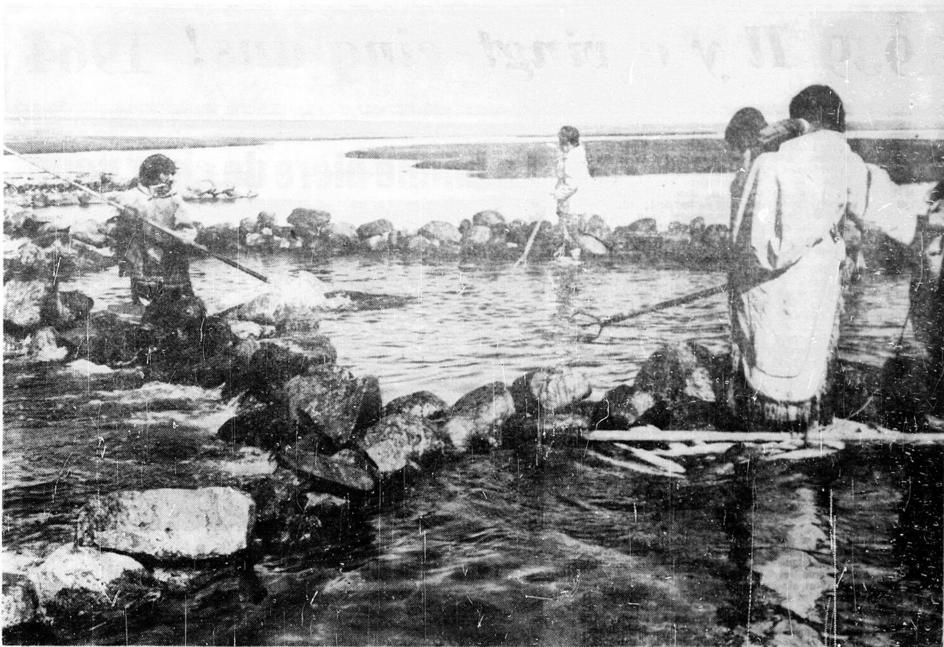
Même la maman esquimaude, avec son bébé retenu au dos, prête son concours à la prise de l'omble arctique. La saison est courte et rapporte beaucoup. Il faut donc faire vite.