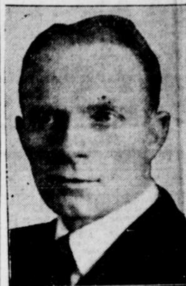
L'hon. Adélar Godbout, premier ministre de la province de Québec et ministre de l'Agriculture, a célébré hier, son cinquante-et-unième anniversaire de naissance.