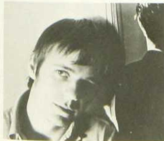
Un homme qui dort