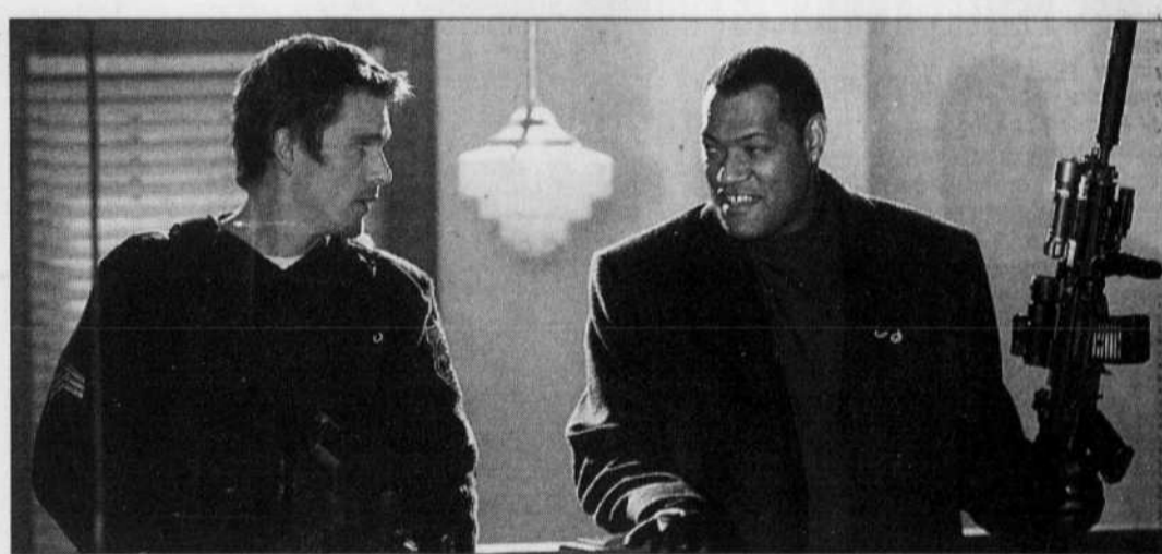
Ethan Hawke et Laurence Fishburne dans une scène du film L'Assaut du poste 13 .

Vous l'aurez compris, c'est l'histoire classique du ver dans la pomme et du mal combattu par le