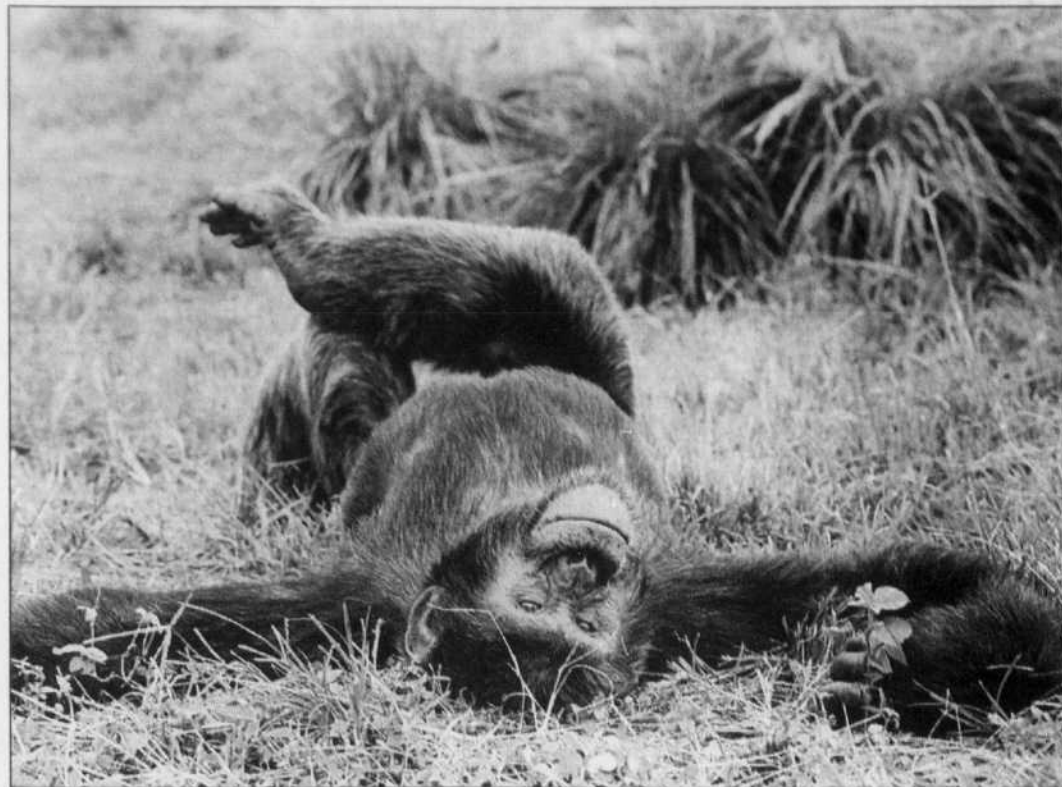
L'Afrique comptait deux millions de chimpanzés il y a un siècle. Il en reste environ 150 000 en raison de la dévastation chronique de leurs derniers retranchements.

Les monts Torngat feront l'objet d'une protection intégrale à la suite d'une entente passée entre Ottawa et les Inuits de cette région afin de les protéger davantage. Ce territoire arctique, qui abrite des montagnes spectaculaires, se retrouve des deux côtés de la frontière du Labrador. Le parc fédéral ne s'étendra cependant que du côté terre-neuvien. Le rapport Dorion de 1968 sur l'intégrité du territoire québécois avait mis Québec en garde contre toute cession territoriale au gouvernement fédéral, ce que tous les gou-