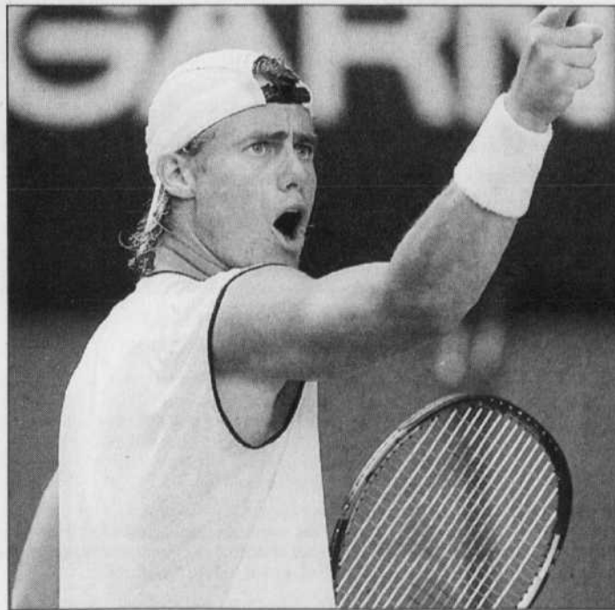
Lleyton Hewitt n'a pas eu la vie facile contre James Blake, mais il est tout de même sorti vainqueur du duel.

«Je n'étais tout simplement pas prête pour le début du match», a admis l'Américaine qui relève d'une bronchite.