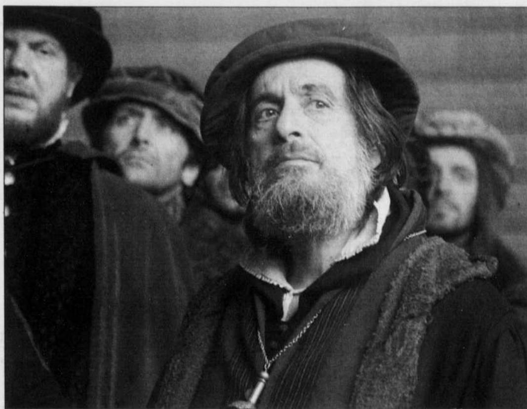
Dans Le Marchand de Venise , Al Pacino se révèle fabuleux, sautant de la rouerie au désespoir en passant par la cruauté, la lâcheté, l'orgueil bafoué.

Il faut se remettre dans le contexte, évidemment. D'ailleurs, le cinéaste Michael Radford prend bien soin, en préambule,