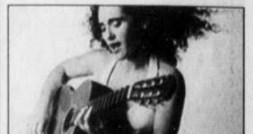
INTERNATIONAL GUITAR NIGHT La Brésilienne Badi Assad.

Un spectacle-bénéfice au profit des sinistrés des tsunamis en Asie aura lieu ce soir à 20h au Medley, à Montréal. Elyse Aussant et Olivier Loubry, comédiens de Watatow , assureront l'animation de la soirée. Plusieurs artistes ont accepté de jouer bénévolement: Ville Énard Blues Band, Manouche, Kumpa'nia, Les Abdigradationnistes ainsi qu'un groupe formé de sept comédiens de Watatow . Tout l'argent amassé sera remis à la Croix-Rouge canadienne.