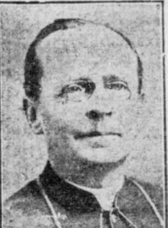
S. G. Mgr BRUCHESI, le principal orateur à la séance générale du Congrès, hier soir.

"Naguère, Messieurs, se tenaient à Montréal, ces inoubliables assemblées et se déployaient ces scènes magifiques dans lesquelles d'illustres prélats d'Europe ont vu des plus