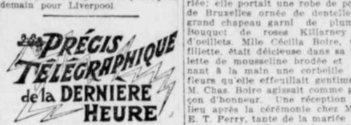
PRÉCIS TÉLEGRAPHIQUE de la DERNIÈRE HEURE