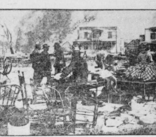
LA CONFLAGRATION DE SAINTE-SCHOLASTIQUE FUYANT LE FEU. PLUSIEURS FAMILLES TRANSPORTENT LEURS MEUBLES ET LEUR LINGÈRE DANS DES TERRAINS VAGUES.