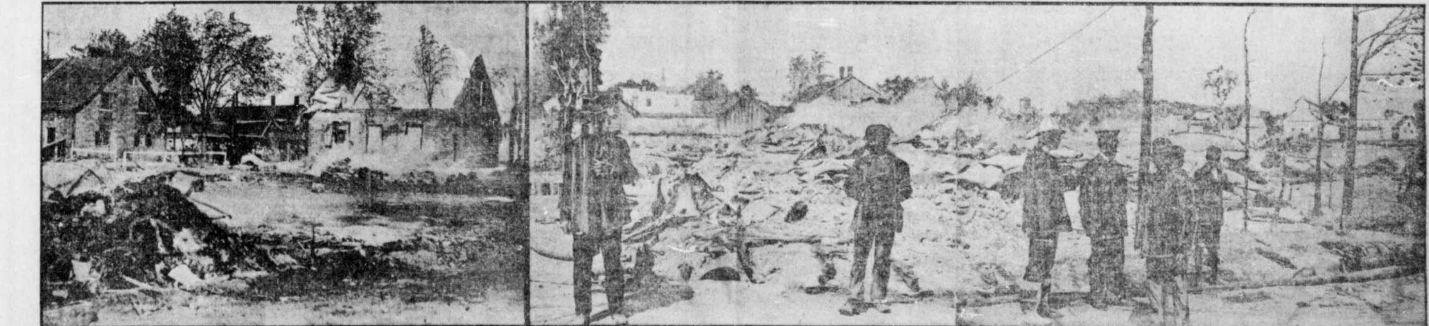
LA CONFLAGRATION DE SAINTE-SCHOLASTIQUE. — Vue panoramique des ruines. A gauche, on voit la maison près de laquelle le feu a été arrêté dans sa marche dévastatrice. A droite de la maison en ruine, dont les murs sont encore debout, on voit la rue qui sépare les deux parties du village ravagé par les flammes.

Paris, 27. — La grève des inscrits maritimes cause des pertes énormes et le gouvernement tente de provoquer une entente entre les compagnies et leurs employés. Les inscrits ont accepté la proposition d'arbitrage faite par le gouvernement, mais les compagnies de navigation, à l'exception de la Compagnie des Messageries Maritimes, l'ont rejetée. Elles prétendent qu'il leur est impossible d'augmenter les salaires.