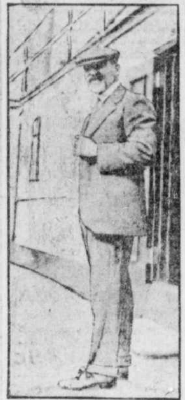
SIR WILLIAM MACKENZIE, à bord du "Royal George", partant pour l'Angleterre.

(Du correspondant de la Presse) Québec, 27. — Sir William Mackenzie, président de la compagnie du chemin de fer Canadien Nord, s'est embarqué hier après-midi sur le paquebot "Royal George" pour se rendre en Angleterre où il va passer quelques semaines.