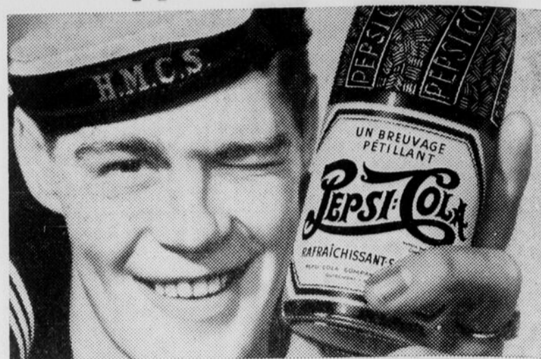
"Pepsi-Cola" est la marque enregistrée au Canada de Pepsi-Cola Company of Canada, Limited EMBOUTEILLÉ PAR