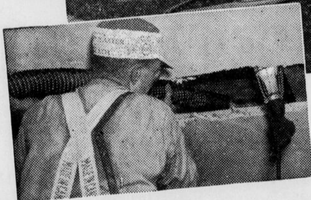
La photo du haut montre la machine pneumatique à l'aide de laquelle nous posons la LAINE MINÉRALE. Photo ci-contre: un ouvrier à l'oeuvre.

CONFORT DURANT LES QUATRE SAISONS 30% D'ÉCONOMIE SUR VOTRE CHAUFFAGE