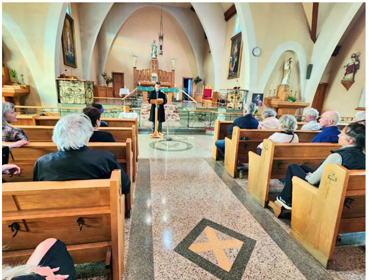
L'intérieur de l'église de Saint-Pierre a accueilli une exposition du Regroupement BLEU lors des dernières Journées de la culture.