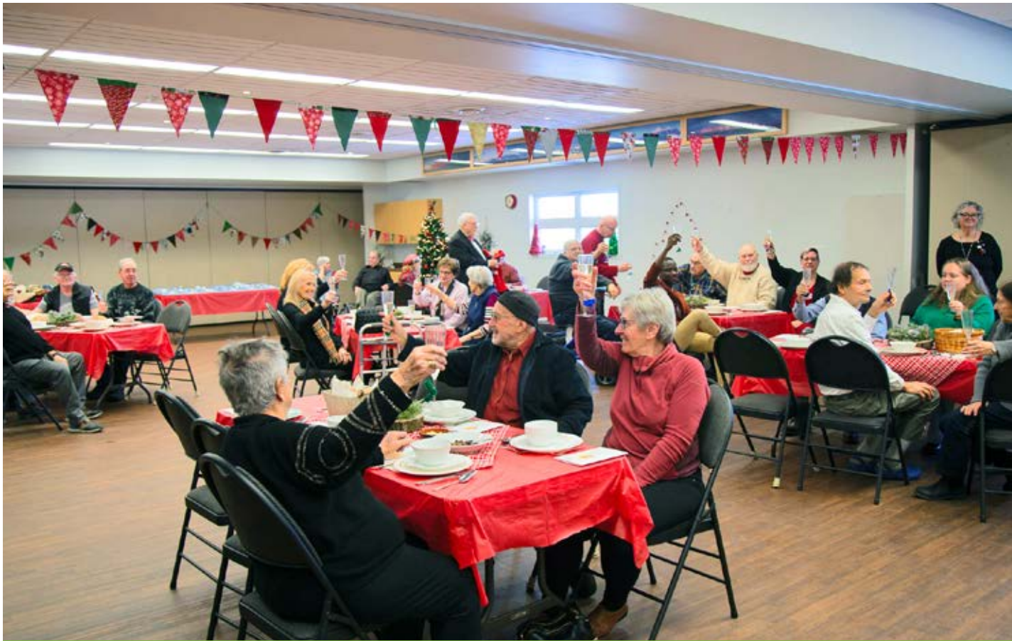
Les participants à la 1 re Grande Table de Noël ont porté un toast à la période des Fêtes.

L'ABIO, qui était appuyée par le Club FADOQ de l'Île d'Orléans, le Cercle de fermières de Saint-Laurent et plusieurs bénévoles de la communauté, a confirmé que la seconde édition aura lieu le 23 décembre 2026, cette fois au gymnase de Sainte-Famille, afin de pouvoir accueillir davantage d'insulaires vivant seuls.