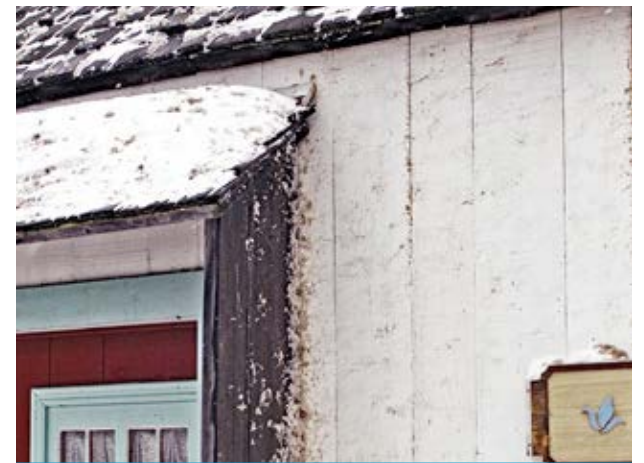
Gadoue et neige projetées en hauteur du mur gouttereau de la grange-remise ancienne au 2209, chemin Royal, à Sainte-Famille.

« Notre espoir est de recevoir leur intérêt et appui pour propulser ce projet qui vise à renforcer, à court et à long terme, la préservation des bâtiments patrimoniaux à risque de dégradation, dont 107 sont situés à seulement 1 à 2 mètres de la route et demeurent fortement menacés si la pratique actuelle de déneigement du MTMD est maintenue », a poursuivi Arthur Plumpton.