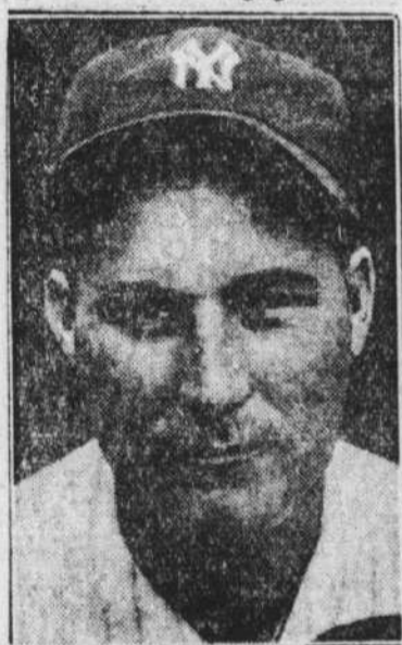
Charley "Red" Ruffing, lanceur du New-York qui a lancé dans la première joute hier et qui a réussi à tenir ses adversaires en échec.

Hartnett frappa un deux-but sur la clôture de gauche. Ruffing cependant se montra fort habile et retira dix hommes au bâton, trois de moins que le record établi par Elnke, des Athletics, dans la série mondiale de 1929 contre les Cubs. Ruth n'a pas particulièrement brillé au champ. Il a commis une erreur de buts en échappant un coup d'English et sans l'aide de Combs qui courut à son secours, il aurait probablement manqué un autre coup profond frappé par le même joueur des Cubs dans la septième manche.