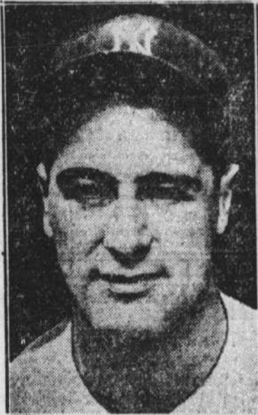
Lou Gehrig, le solide cogneur des Yankees, qui a largement contribué à la victoire de son club sur les Cubs en frappant un coup de circuit hier.

Deux coups simples par la suite firent compter quatre points. Il y avait trois points de comptés, les buts étaient remplis et il n'y avait qu'un homme de retiré lorsque Grimes remplaça Bush. Ruffing au bâton frappa à l'intérieur du champ pour forcer Dickey au marbre. Combs réussit un coup simple qui fit compter deux autres points pour porter à cinq le total de cette manche.