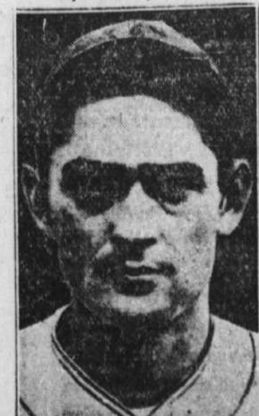
Guy Bush, le meilleur lanceur des Cubs, n'a pu empêcher la grosse artillerie des Yankees de frapper ses balles dans la partie d'ouverture. Il compte se reprendre.