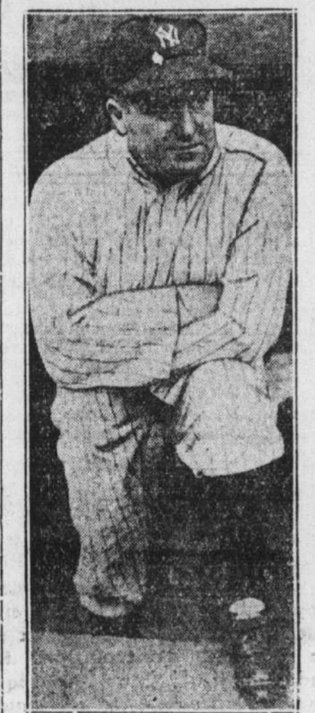
Joe McCarthy, gérant des Yankees de New-York, qui a conduit son équipe à la victoire hier après-midi dans la première partie de la série mondiale.