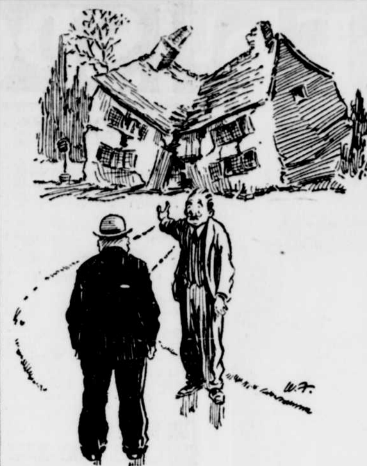
Le propriétaire de la maison ébranlée (au constructeur) : "Je vous certifie que c'est ma femme qui est le plus épuisée dans cette affaire". The Humorist.