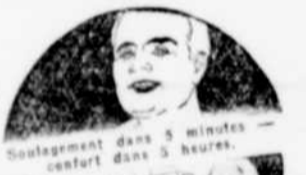
Portrait of a woman, likely related to the 'St-Genève de Batiscan' section.

Emulsion de Scott est vendue partout. Chez votre pharmacien, en gros, en petites bouteilles pour le voyage. Agents des ventes: Harold F. Ritchie & Company, Ltd., Toronto.