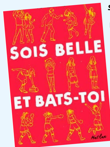
Sois belle et bats-toi / Tom Easton

Rosa, 14 ans, veut devenir peintre animalière. Elle espère gagner sa vie en vendant ses tableaux et ne compter sur personne d'autre qu'elle-même. Mais, au XIX e siècle, seuls les garçons sont autorisés à suivre des études d'art. Désespérée, Rosa fait la connaissance de Nathalie, une fille à la santé fragile. Ensemble, les deux adolescentes s'apprennent à braver les interdits et à conquérir leur liberté. Après Marie et Bronia, le pacte des sœurs , l'auteure réalise ici le portrait d'une femme qui ne recule devant rien pour se libérer du carcan de son époque et compter parmi les peintres les plus célèbres de l'Histoire. Pour ados.