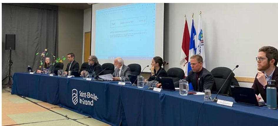
La mobilisation citoyenne ne considère pas avoir l'appui de la Ville de Saint-Basile pour qu'un projet de réfection complète et de revalorisation du chemin du Richelieu ait lieu.

Électricien de profession, il a finalement dû s'absenter pour répondre à une panne. Après avoir pris connaissance de l'exposé du Ministère, qui ne prévoit que des travaux d'asphaltage sur la 223, il se prononce : « Ça ne répond pas du tout à nos enjeux! La Ville doit agir. »