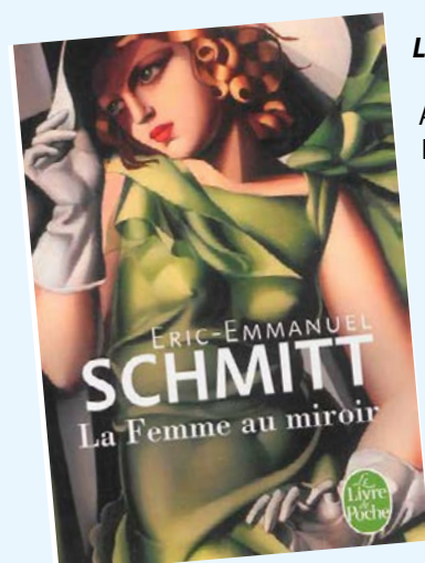
La femme au miroir / Eric-Emmanuel Schmitt

Fleur, 16 ans, découvre par hasard la boxe, qui devient une vraie passion. Pourtant, sa mère et son petit ami n'apprécient guère cette nouvelle activité. Pour gagner sur le ring, il faut : avoir du muscle, ingurgiter des tonnes de protéines, s'entraîner encore et encore, faire des sacrifices. Pas facile quand on a 16 ans et que l'on a toujours eu une image lisse de fille douce. Pour Fleur, c'est le début d'une révolution intérieure... Et ce n'est pas du goût de tout le monde. Ni de ses parents surprotecteurs, ni de son copain un peu macho. Mais parfois, c'est bon de boxer les clichés! Pour ados.