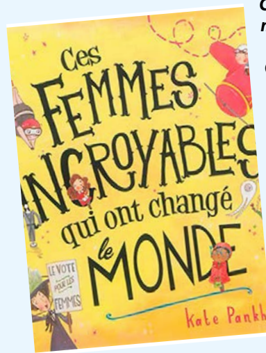
Ces femmes incroyables qui ont changé le monde / Kate Pankhurst

Élise Gravel n'a pas besoin de présentation. C'est une star des cours d'école. Que ce soit avec sa série documentaire Les petits dégoûtants ou ses grands albums comme La clé à molette , l'auteure peut se vanter d'avoir attiré vers la lecture les enfants. Une fille qui pète ou qui parle fort, c'est possible? Un garçon qui pleure, qui fait la cuisine ou qui danse? Bien sûr! Dans Tu peux , Élise Gravel s'attarde à déconstruire de façon ludique les stéréotypes de genre afin de permettre aux enfants d'être tout ce qu'ils désirent être. Tu peux est la version papier de l'album numérique publié à l'origine sur le blogue de l'auteure. Pour enfants.