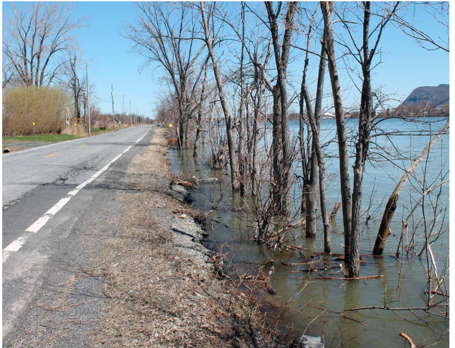
Des enjeux de longue date empêchent la pratique sécuritaire d'activités comme le vélo ou la marche le long du chemin du Richelieu.

« L'arrivée de Northvolt implique des changements aux infrastructures existantes. Une fois [l'usine] installée, les fonds alloués