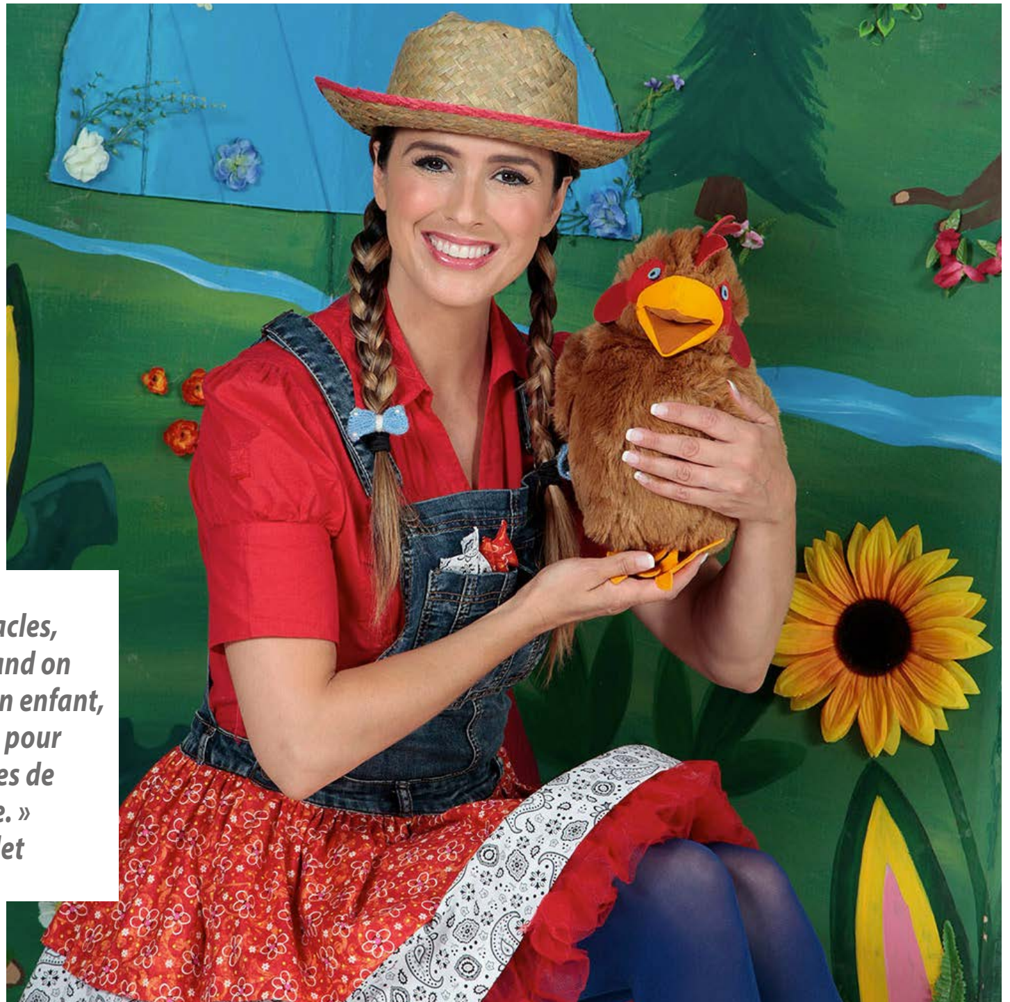
Les enfants sont invités à entrer dans l'univers imaginaire de La petite poule aux yeux bleus en participant à la pièce de théâtre.

Sur le site Web des Productions du Baluchon magique, un souci de véhiculer des valeurs comme l'amour de la nature et