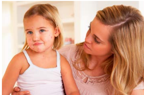
La rougeole est de retour au Québec.