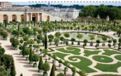
Château de Versailles