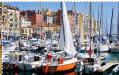
Port de Nice