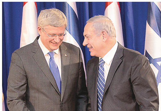
Stephen Harper, en compagnie du premier ministre israélien, Benjamin Nétanyahou

Stephen Harper a dit être enchanté de se trouver en sol israélien, mais a indiqué qu'il ferait davantage de commentaires à l'occasion de