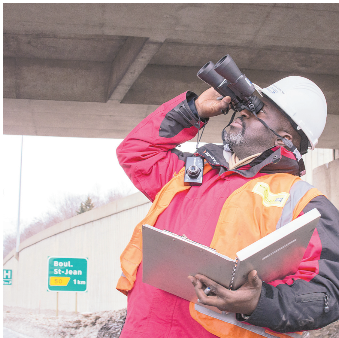
Dans la région de Montréal, les inspecteurs du ministère ont examiné 112 structures routières, dont 11 ont nécessité des travaux d'urgence.