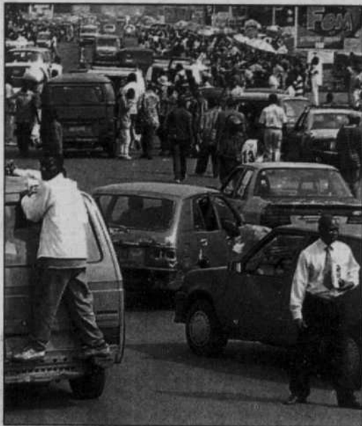
Les rues de Kinshasa ont retrouvé leur vie normale à la suite du putsch raté, hier en matinée.