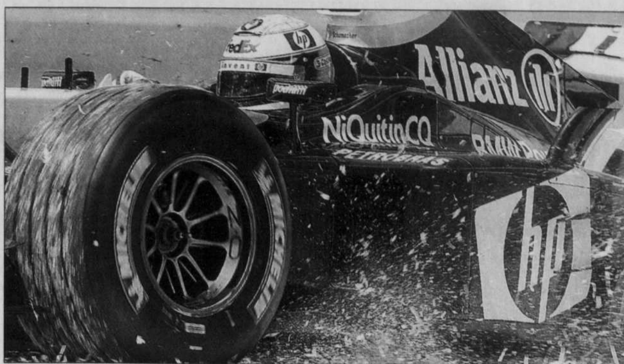
Ralph Schumacher, alors qu'il négociait un virage dans le gravier.