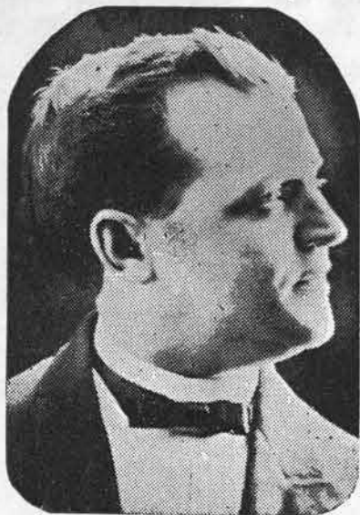
DUBUISSON du Ouimetoscope