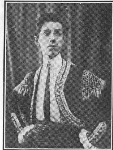
GRANIER du Nationscope