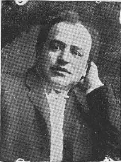
FILION du National