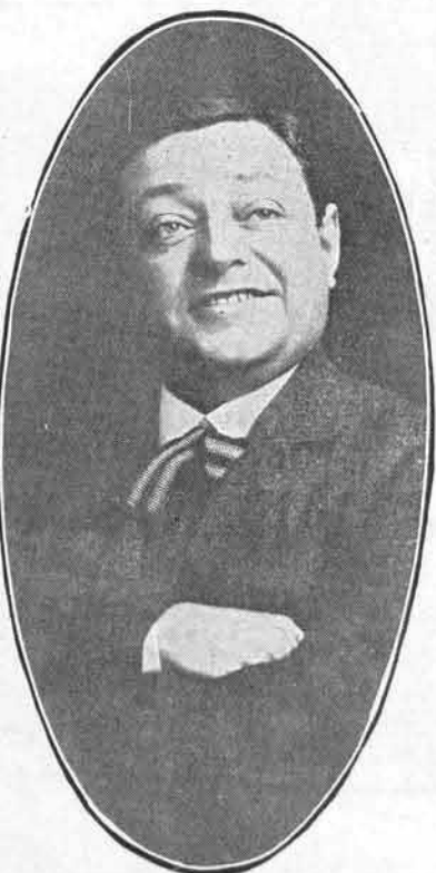
DUMESTRE du National