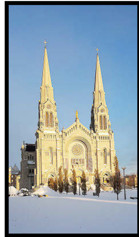
Basilique de Sainte-Anne-de-Beaupré en hiver.