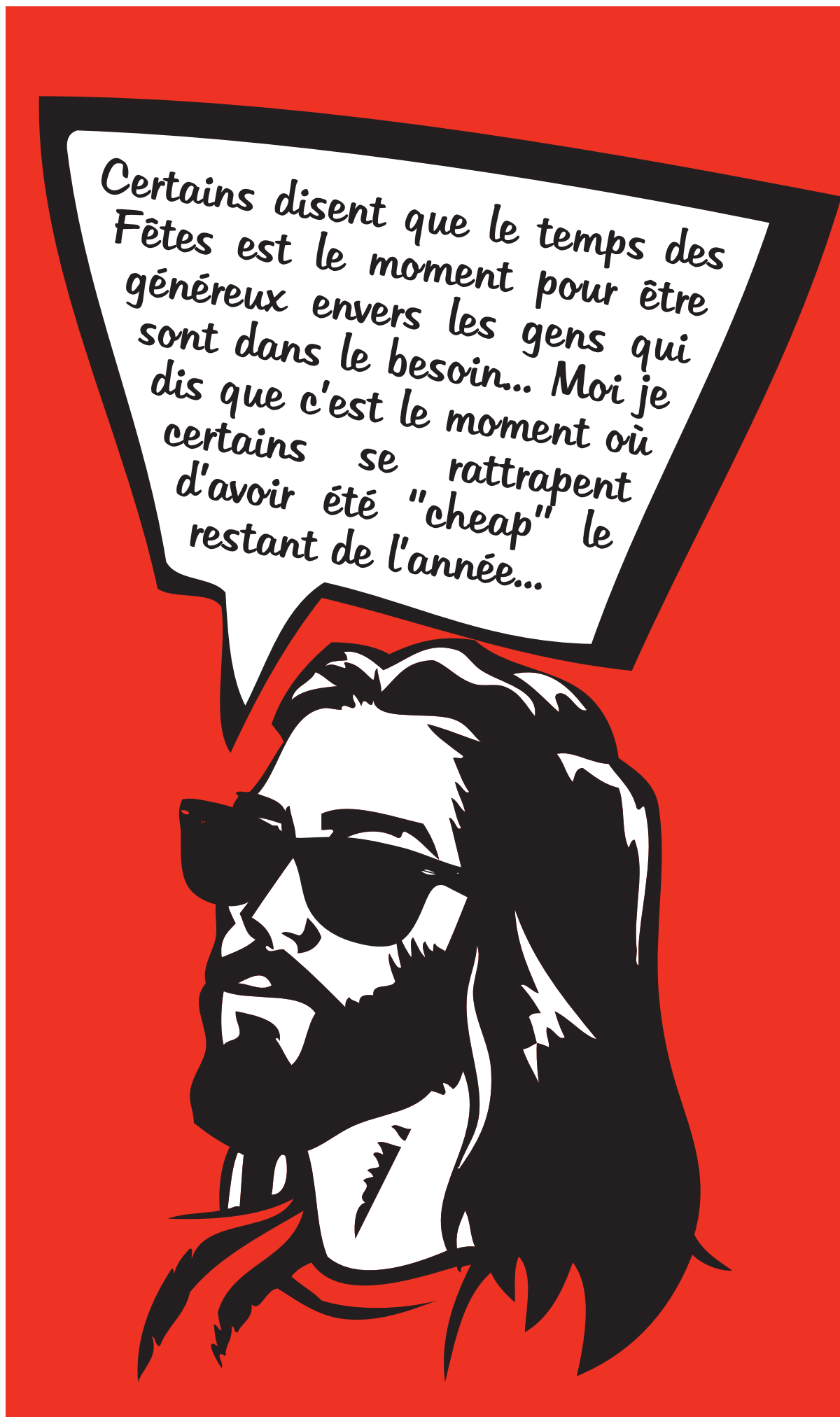
Illustration : Etienne Ménard

Cependant, après 1 h 30 d'exploration critique de la pensée productiviste et des phénomènes d'appropriation qui créent la richesse et la croissance, il est décevant de voir que les auteurs ont le réflexe de réfléchir à l'aide des mêmes outils que l'idéologie qu'ils attaquent; avec les entreprises et le marché de l'offre et la demande. D'ailleurs, Mathieu Roy témoignera de cette mollesse sur le plateau de « Tout le monde en parle » en espérant l'éventuelle responsabilisation des entreprises et des dirigeants et en enfermant les citoyens dans leur rôle de consommateur qui exerceraient leur pouvoir à travers le marché de l'offre et de la demande. Bien sûr, personne ne niera l'importance d'acheter des biens et des services socialement et environnementalement responsables, mais est-ce suffisant pour éviter un mur qui s'approche dangereusement ?