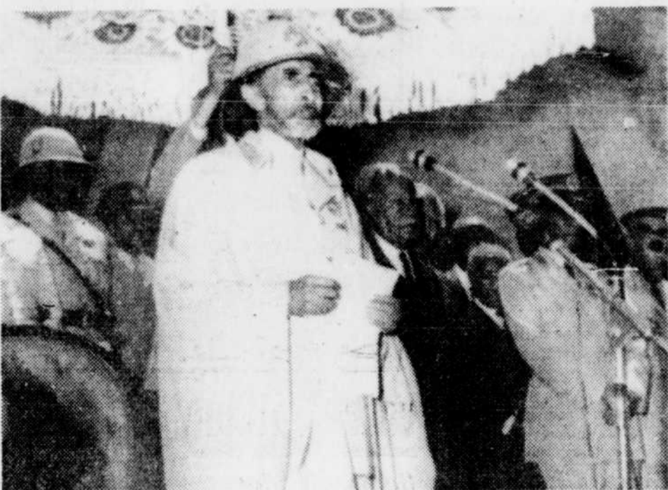
Dans l'espoir de ramener le calme en Éthiopie, l'empereur Haïlé Sélassié a désigné, hier, un nouveau premier ministre et lui a demandé de lui soumettre le plus tôt possible la liste des membres de son cabinet. On voit ici Sélassié s'adressant aux membres des forces armées.

et ont pour but de créer des dissensions parmi les soldats et les policiers. Une augmentation de 12 pour cent de la solde et des rations des militaires a été annoncée jeudi par Radio Éthiopie. Ceci porte à 37 pour cent l'augmentation totale des soldes et des rations consentie au cours de la dernière semaine.