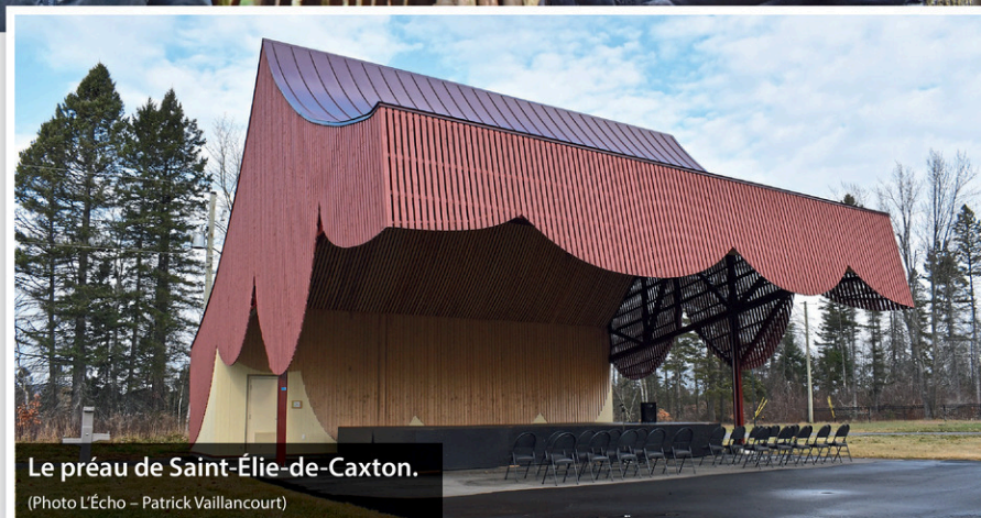
Le préau de Saint-Élie-de-Caxton.

La cérémonie d'inauguration s'est terminée par le dévoilement d'une oeuvre d'art réalisée par l'artiste trifluvienne Alejandra Basanes qui a été installée dans la bibliothèque municipale. Cette oeuvre a été acquise dans le cadre du Programme d'intégration des arts à l'architecture et à l'environnement en lien avec l'aménagement du Parc de l'imaginaire.