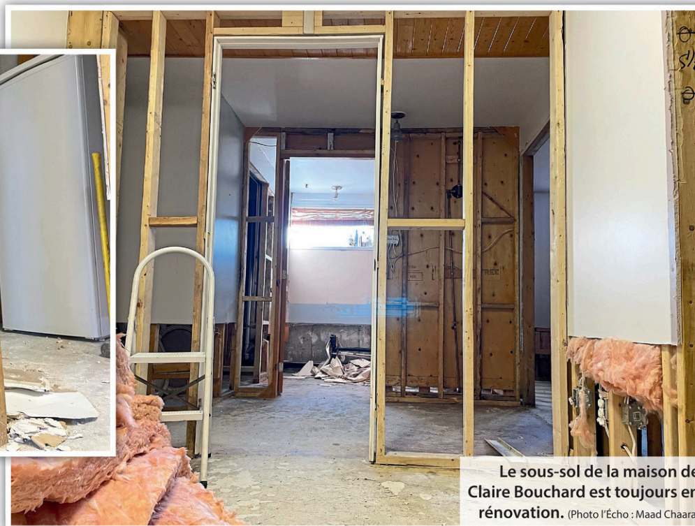
Le sous-sol de la maison de Claire Bouchard est toujours en rénovation.

fourni des bons alimentaires, pour compenser un peu pour la nourriture.