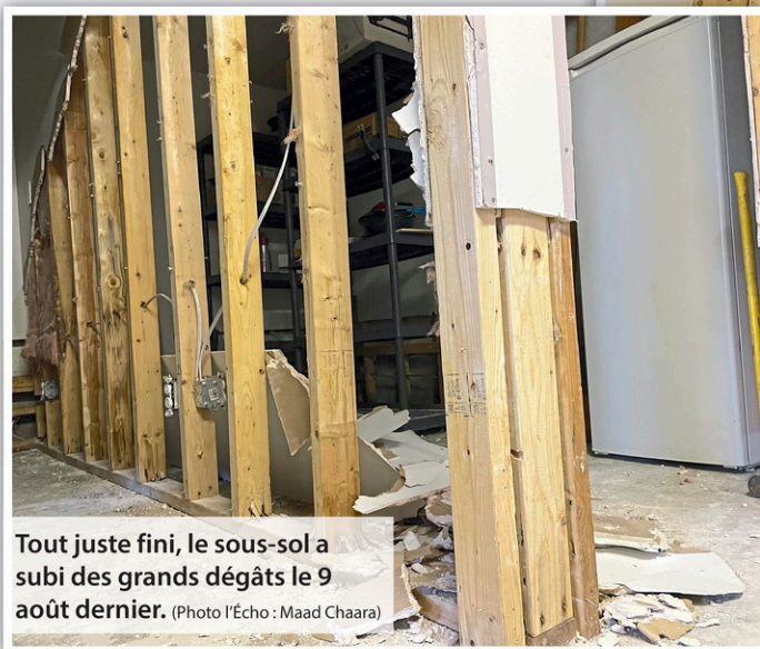
Tout juste fini, le sous-sol a subi des grands dégâts le 9 août dernier.