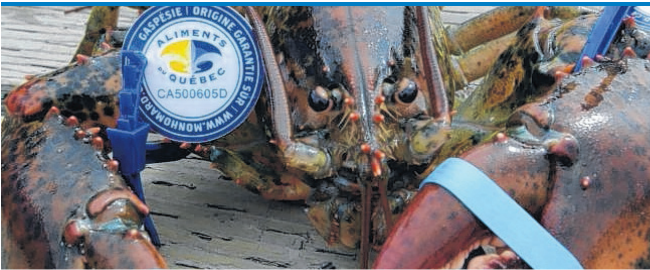
La pêche au homard gaspésien a débuté le 2 mai.