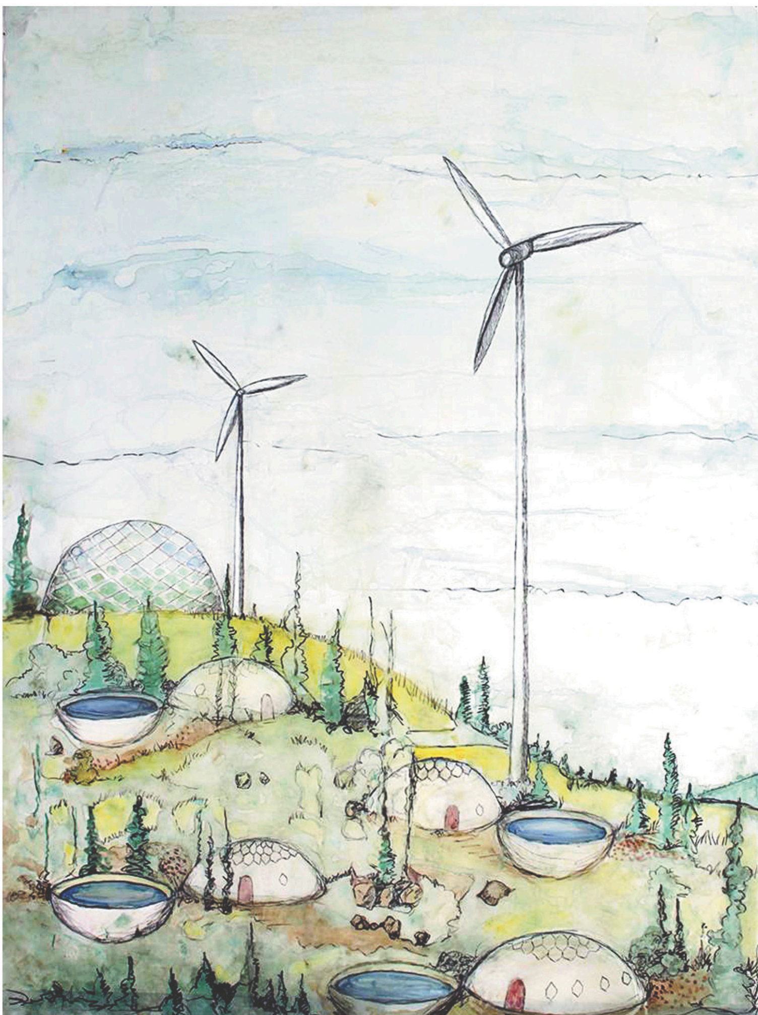
L'œuvre 7th Generation Inuit Community , de l'Inuite Heather Campbell, montre de quoi aurait l'air un paysage du Nord où les sociétés occidentales auraient été contraintes de s'installer en raison du réchauffement climatique.

ENTRETIENS CONCORDIA — MUTATIONS NUMÉRIQUES