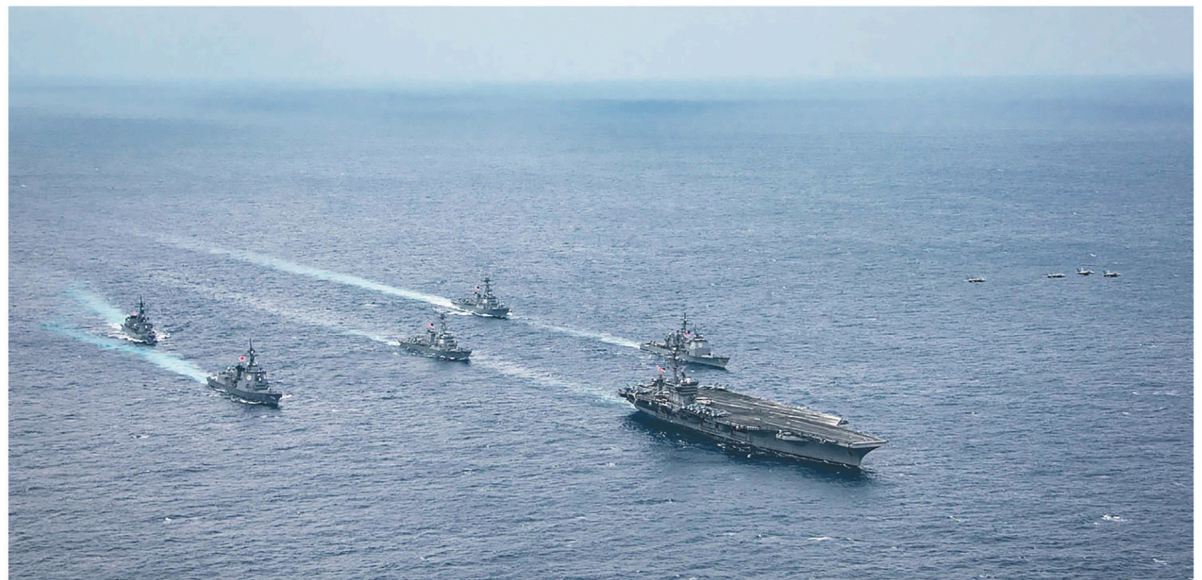
Un exercice naval se poursuit pour la Corée du Sud et les États-Unis en mer du Japon, impliquant notamment le groupe aéronaval américain emmené par le porte-avions Carl Vinson (sur la photo).

francobrousseau@hotmail.com François Brousseau est chroniqueur d'information internationale à Radio-Canada.