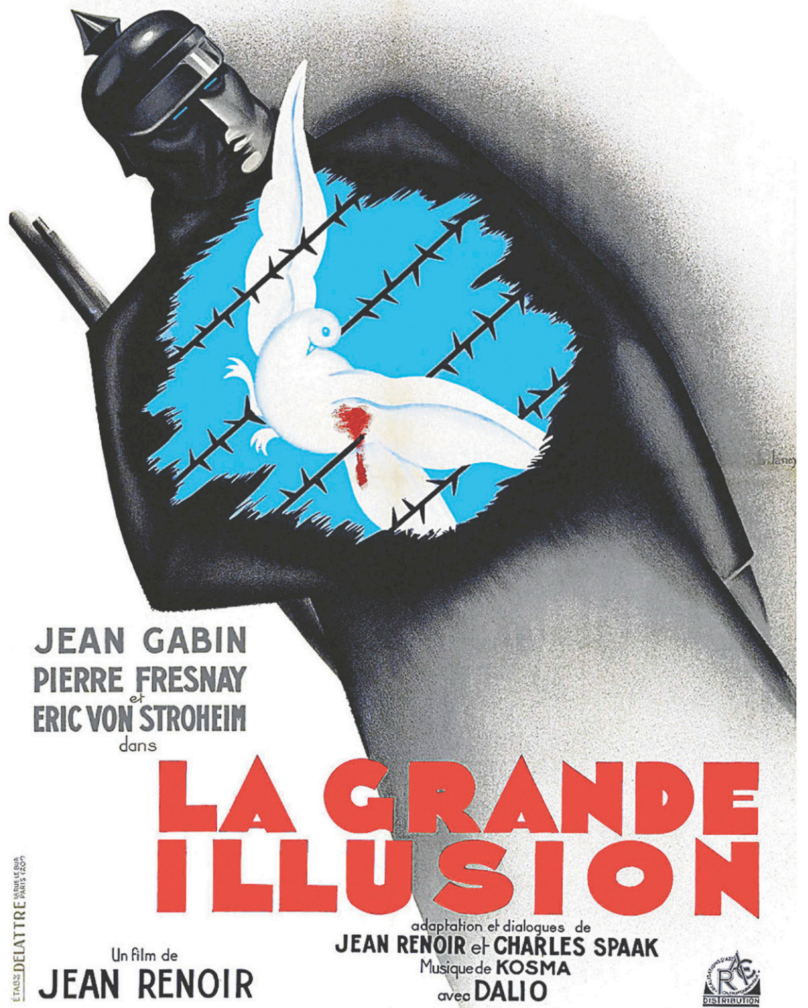
Affiche originale du film La grande illusion , de Jean Renoir

Je ne peux que souhaiter, aujourd'hui, que le