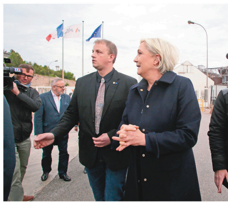
Marine Le Pen a improvisé une visite à Gardanne, dans le sud de la France, pour vanter sa vision d'une « véritable écologie ».

Elle a également improvisé une visite à Gardanne (sud) liée au rejet de boues polluantes pratiqué par une usine pour vanter sa vision d'une « véritable écologie ». Elle est