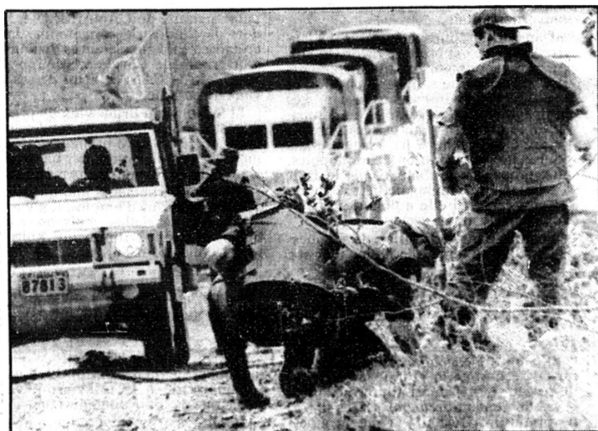
Que font nos soldats dans cette galère?