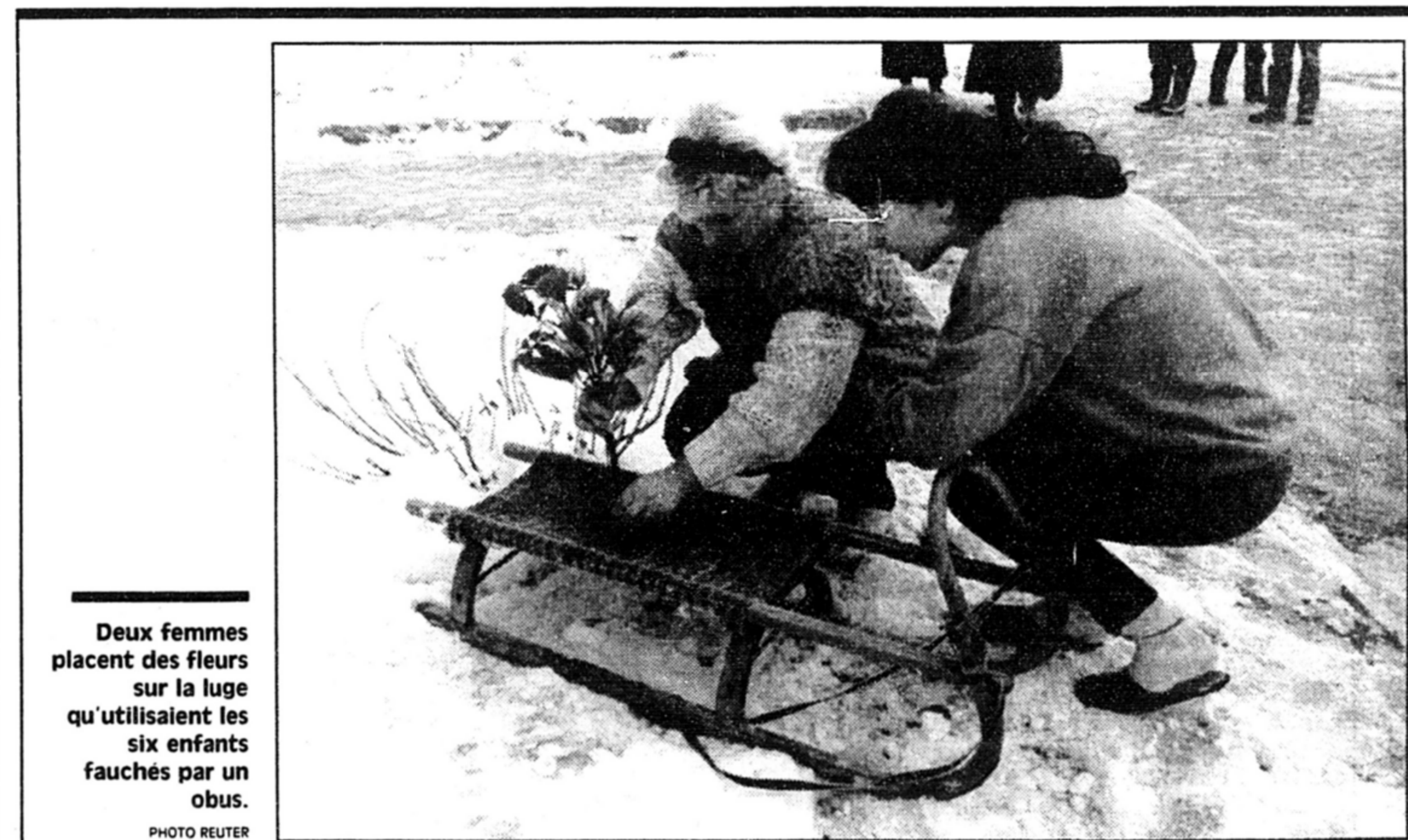
Deux femmes placent des fleurs sur la luge qu'utilisaient les six enfants fauchés par un obus.

Le président Aristide mènera demain la délégation haïtienne à Toronto pour une série d'entretiens avec le premier