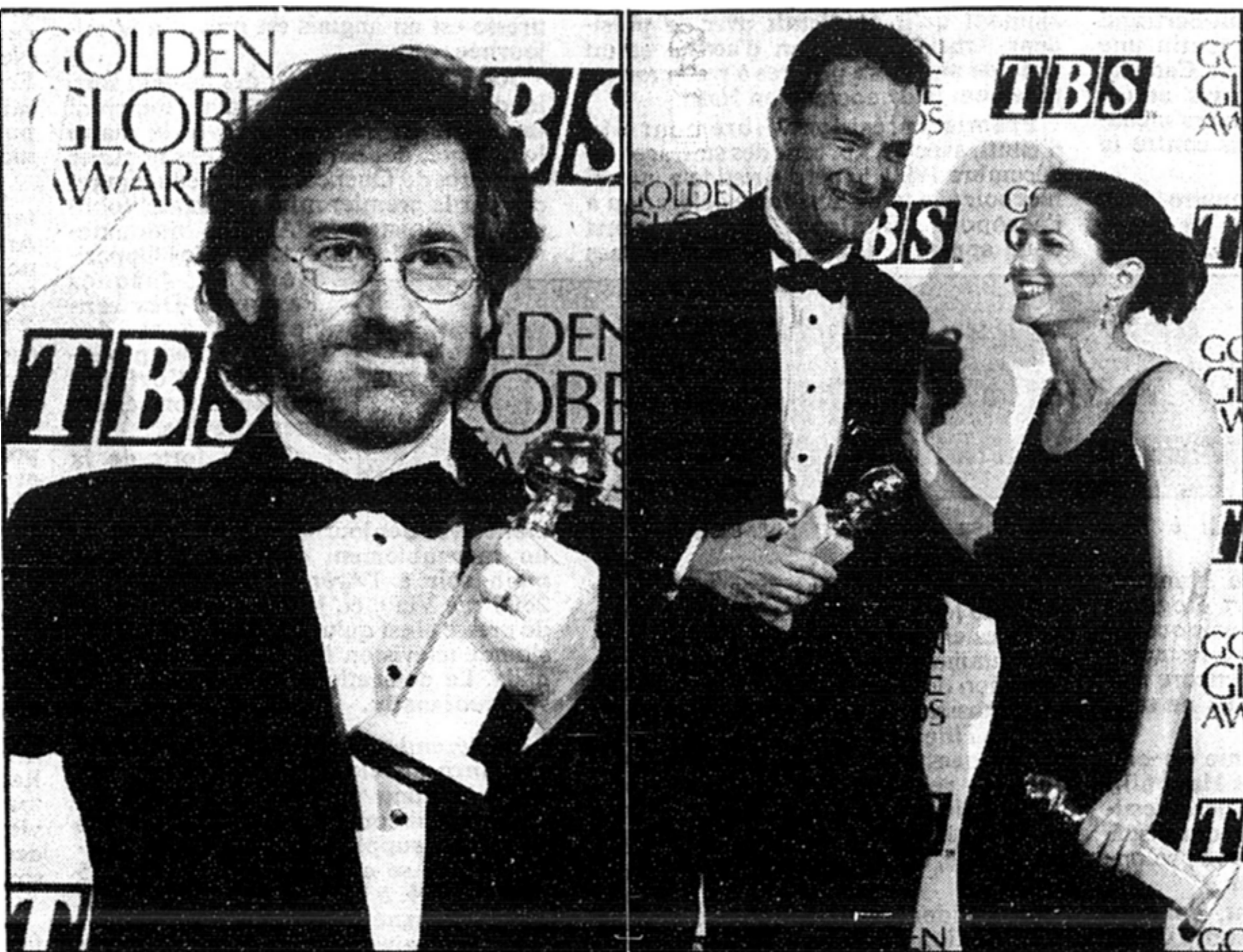
Steven Spielberg (à gauche) tient enfin le Golden Globe du meilleur réalisateur qu'il attend depuis si longtemps, tandis que Tom Hanks et Holly Hunter, récompensés pour leur rôle respectif dans Philadelphia et La Leçon de piano , ne cachent pas leur joie.

Le meilleur second rôle masculin a été attribué à Tommy Lee Jones pour Le Fugitif et le meilleur second rôle féminin à Winona