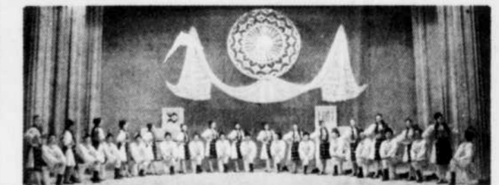
Danse — Chant — Musique

Salle Gilles-Lefebvre — 20h00 Entrée: $10.00 Ensemble folklorique roumain "JUNII SIBIULUI" en collaboration avec le Festival de folklore de Drummondville.