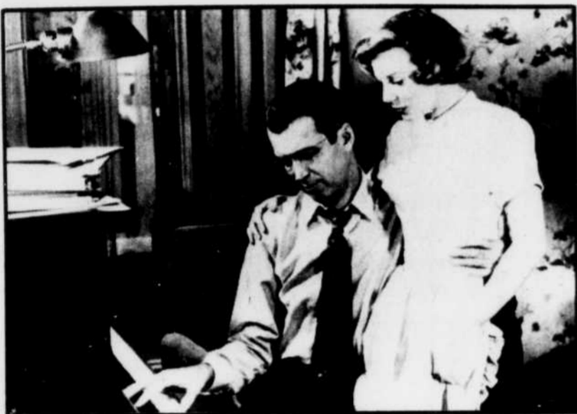
Glenn Miller (James Stewart) et Helen (June Allyson): "The Glenn Miller story", c'est aussi une grande histoire d'amour.