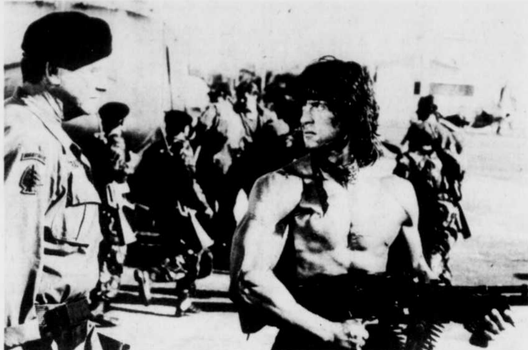
Une scène du film Rambo, mettant en vedette Sylvester Stallone (Rambo) et Richard Crenna (le colonel Trautman).

Dans "First Blood", Rambo rentrait de la guerre, où il s'était couvert de gloire, pour être accueilli comme un pestiféré. La rage au cœur, il allait se réfugier en solitaire dans les forêts humides du Nord-Ouest américain et à la suite de divers malentendus se retrouvait aux prises avec des milliers de soldats de la garde nationale. Sa pugnacité devait l'envoyer au bagne. Fin du premier épisode et début du second.