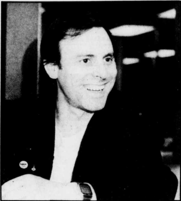
Pierre Rapsat: on a tous quelque part quelque chose que l'on sait faire.

■ "J'ai quelque chose à faire; c'est de créer un son, un texte, une mélodie. Pour moi la musique, c'est un choix définitif parce que je sais que j'ai quelque chose à dire."